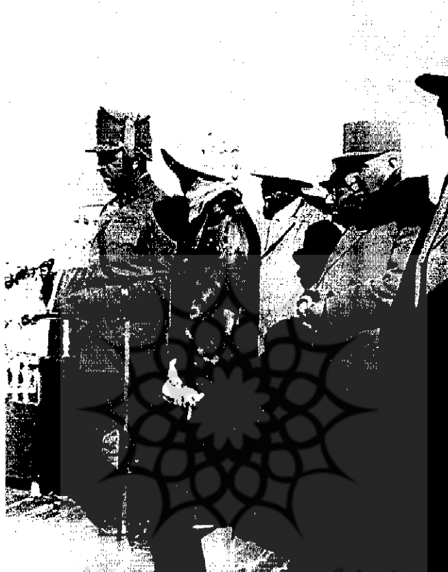
امان‌الله‌خان پادشاه افغانستان و همسرش ثریا در سفر به ایران (۱۹-۱۶ع)

اقداماتی که در نتیجه جنبشهای زنان در کشورهای اروپایی صورت گرفته بود، دولت ایران رأساً به تصویب لوایحی در امور زنان پرداخت که می‌توانست در زندگی اجتماعی آنان مفید باشد و درجه اعتماد آنان را به حکومت و تمامی اقداماتی که در مورد زنان صورت می‌گرفت، بالا ببرد. از جمله این لوایح، لایحه‌ای برای تغییر قانون ازدواج در ایران از سوی مجلس شورای ملی در سال ۱۳۱۰ بود.