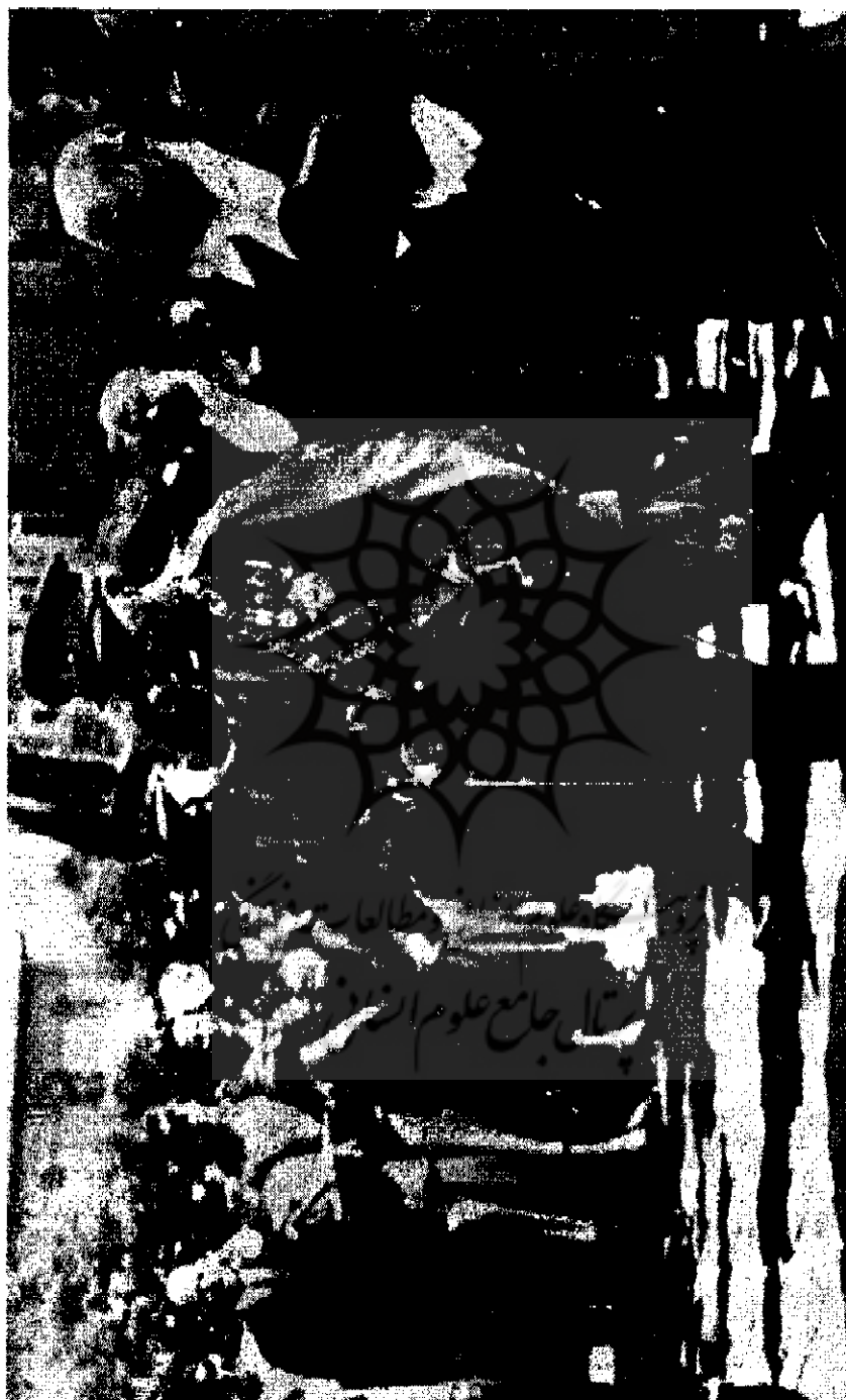
رضاشاه و کمال آنتورک رئیس جمهور ترکیه در آنکارا | ۸۷-۱۳۳۱ ه. ش