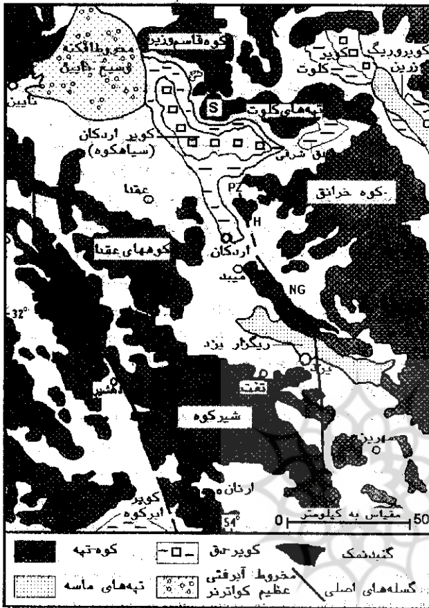
نقشه ۴ موقعیت کوهستان‌ها، چاله‌ها و گسل‌های