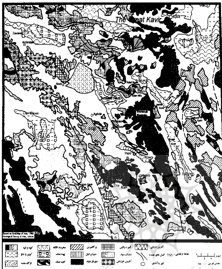
نقشه ۲ موقعیت چاله‌ها و ارتفاعات استان یزد