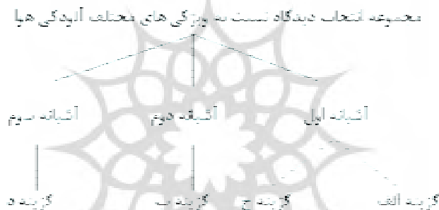
نمودار ۲ - ساختار متداخل الگوی Nested logit در منطقه با آلودگی بالا

از این گزینه‌ها بایستی در تصریح الگوی لاجیت متداخل در آشیانه‌ای ۱ مجزا قرار گیرند، به گونه‌ای که در داخل هر یک از آشیانه‌ها فرض واریانس همسانی بین گزینه‌های مختلف الگوی لاجیت شرطی رعایت شود و احتمالات نسبی انتخاب آن‌ها مستقل از یکدیگر و سایر گزینه‌ها شود، بنابراین بایستی در تصریح الگوی لاجیت متداخل منطقه‌ی با آلودگی زیاد، سه آشیانه در سطح والد ۲ (سطح دوم) ایجاد شود، به گونه‌ای که در آشیانه‌ی (لانه) اول، گزینه‌های الف و ج، که فرض IIA را برآورده می‌کنند، در سطح فرزند ۳ (سطح اول) جای می‌گیرند. در آشیانه‌ی دوم، گزینه‌ی ب و در آشیانه‌ی سوم نیز گزینه‌ی د در سطح اول قرار می‌گیرند. ساختار متداخل الگوی لاجیت متداخل در منطقه‌ی با آلودگی زیاد در نمودار ۱ نشان داده شده است.