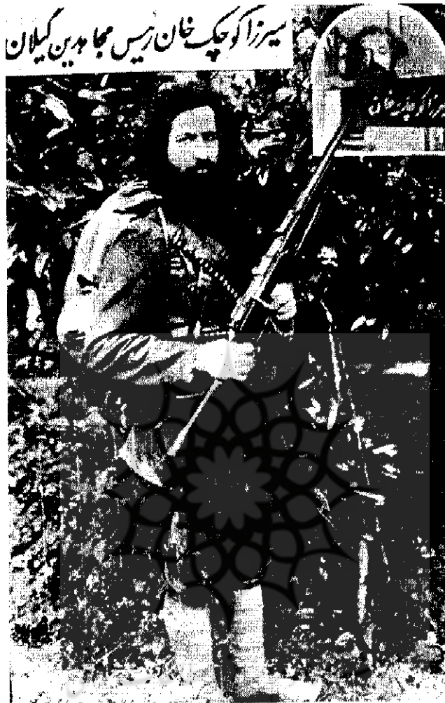
میرزا کوچک خان | ۱۱۰۴۶۶۸

علوم سیاسی دانشگاه تهران از انگلیسی به فارسی ترجمه کرده‌اند. (۱)