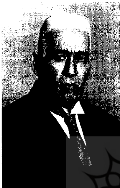
قاسم غنی | ۱۵-۲۶۰۴