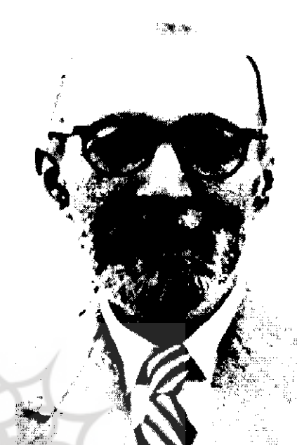
ملک‌الشعراء بهار | ۱۵-۴۶۵۰

از متون قدیمی ارزشمند به زبان لاتین نگارش یافته‌اند، و این در حالی است که زبان فارسی هزار سال پیش هنوز برای مردم ایران قابل فهم است. پس چگونه است که اولیای فرهنگ در کشورهای یاد شده تدریس زبان مرده لاتین را در مدارس امری ضروری می‌دانند اما در کشوری که حتی به اعتراف بیگانگان سرزمین ادب خوانده شده ما نسبت به آنچه از گذشته در نسخ قدیمی، بناهای کهن و بر پیشانی اماکن متبرکه به جای مانده بی‌مهری و بی‌توجهی روا می‌داریم. انتظار آن است که آثار گذشته به دیده حرمت پاس داشته شوند و برای حفظ هنر ماده‌تاریخ‌سازی ضروری است ماده‌تاریخها و تعمیه‌های به کار رفته در آنها تجزیه و تحلیل و تشریح و تبیین شوند.