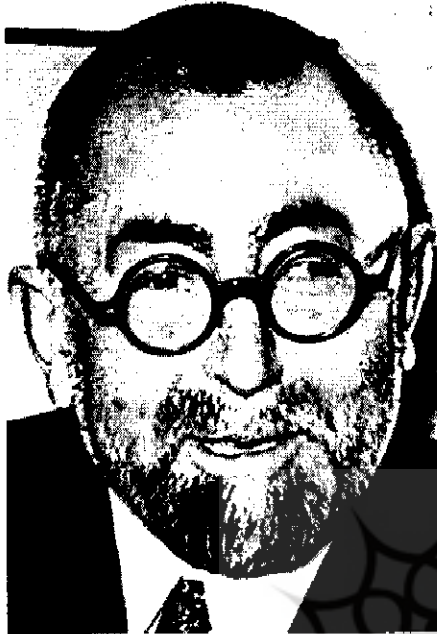
بدیع الزمان فروزانفر