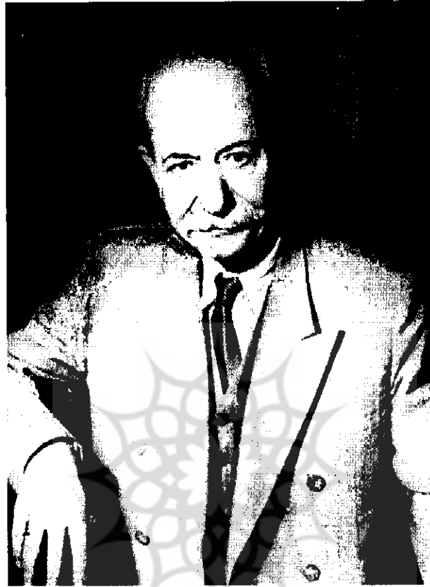
علی‌اکبر دهخدا | ۱۵-۴۶۵۶

در مصرع چهارم از جمع کردن معادله‌های عددی حروف «ت»، «س» و سه «ج» به حساب جمل سال ۴۶۹ حاصل می‌شود. علوم انسانی و مطالعات فرهنگی اما گفتن «ماده تاریخ» به همین نحو منحصر به استفاده از حروف مقطعه ابجد نگردید؛ از قرن ششم به بعد سرایندگان از حروف ابجد به جای رقم استفاده کردند هر چند هنوز مقید نبودند که حروف مورد استفاده معنی مشخصی را به ذهن متبادر کند. چنانچه در دو بیتی معروف زیر «ماده تاریخ» ولادت، کسب علوم و درگذشت ابن سینا با کلمات بی معنی «شجع»، «شصا» و «تکز» که به ترتیب معادل ۳۷۳، ۳۹۱ و ۴۲۷ است گفته شده: