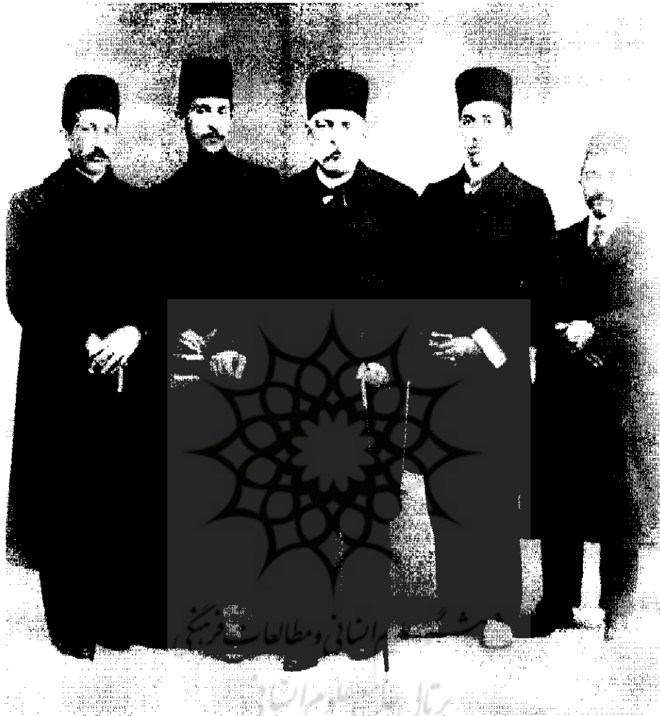
از چپ: محمدحسن خان امین‌الملک - محمد مصدق - عبدالحسین میرزا فرمانفرما