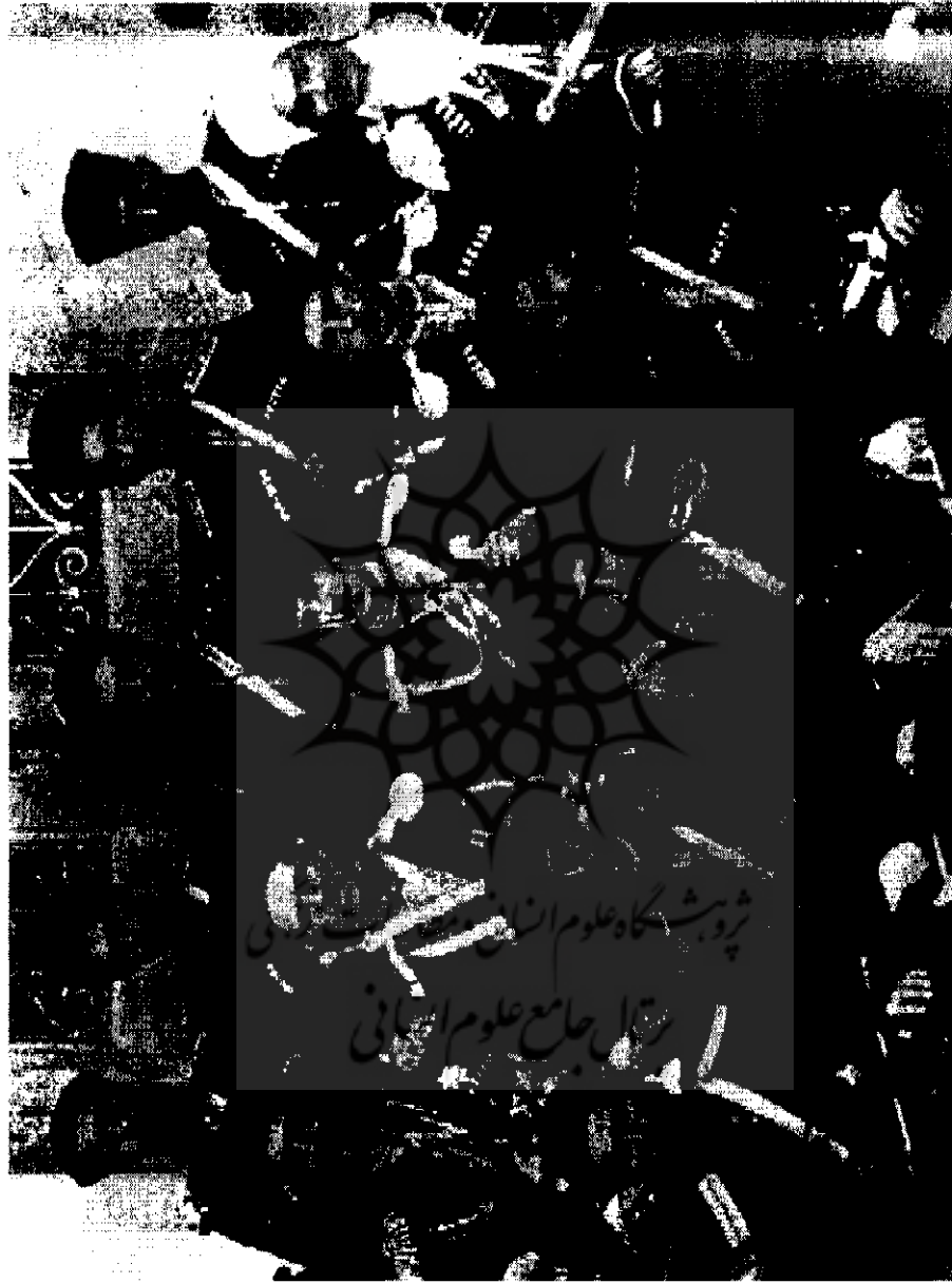
سرهنگ رضاخان در میان جمعی از افسران ایرانی و روسی تزارخانه | ۵۷۱-۱۲۲۴