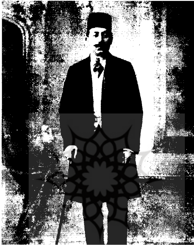
احمد قوام (قوام‌السلطنه) [۴۸۹-۱]