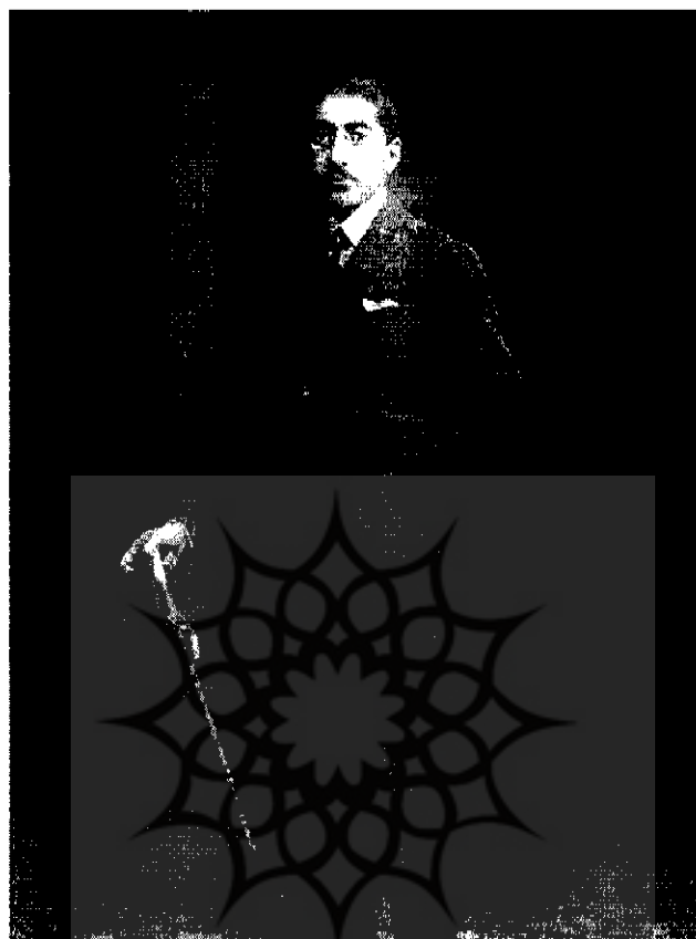
فیروز میرزا فیروز (نصرت‌الدوله) | ۱۷۹-۱۱

ما اغلب از ایران و از آنچه که می‌توانیم برای این کشور انجام دهیم صحبت کرده‌ایم. من به حُسن نیت جنابعالی واقفم و مثل یک دوست از آنها باخبرم و برای موفقیت شما آرزو می‌کنم. من به روح عدالتخواهی حضرتعالی واقفم و به همین خاطر است که برای شاهزاده نصرت‌الدوله پادرمیانی می‌کنم. وی [نصرت‌الدوله] از سوی پادشاه بلژیک عالی‌ترین درجه نشان بلژیک، نشان لژیون را دریافت داشته است.