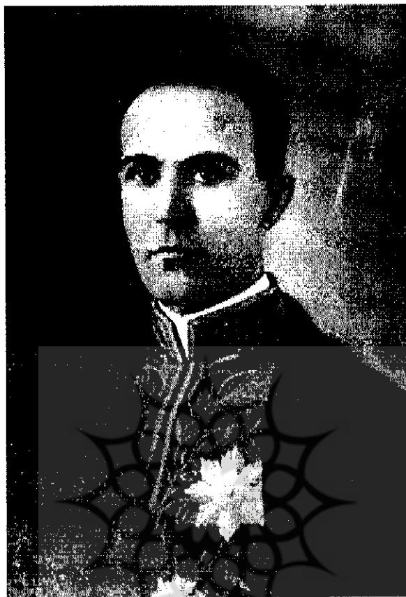
احمدعلی سپهر (مورخ الدوله) [۱۳۵۷-۱]

پژوهشگاه علوم انسانی و مطالعات فرهنگی [۴۶]