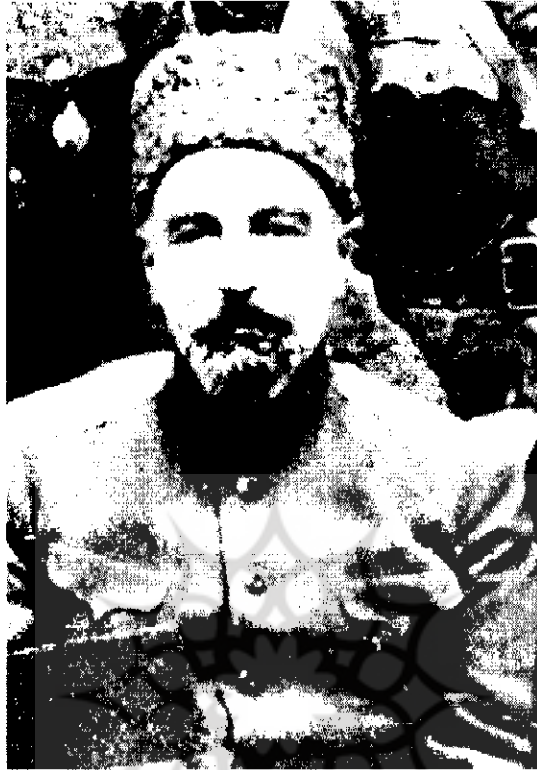
پالکونیک استاروسلسکی آخرین فرمانده روسی قزاقخانه

دهند. موضوع مورد بحث دیویزیون قزاق است که در جریان وقایع اخیر عمیقاً تغییر پیدا کرده است. از حضرت اشرف تقاضا دارم عجلتاً دیگر وجهی به کلنل استاروسلسکی نپردازید.