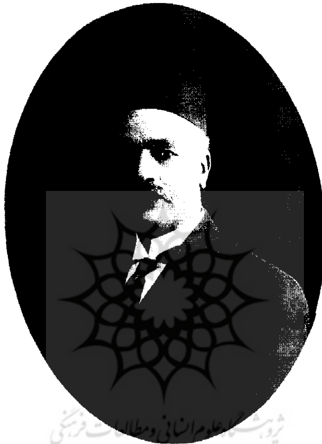
آرباب کیکرو شاهرخ | ۱۱-۶۸۳۹

نه روز است به همین منوال می‌گذرد و اگر دیرتر شود به علاوه آنکه از توقیف بعد ازین نتیجه برای دولت متصور نیست ورود خسارت به شرکت تلفن محتمل است زیرا به علاوه آنکه خرج و حقوق اجزاء از مسلمیات می‌باشد نیز ممکن است صاحبان آبونه در تأدیه آبونه متعذر شوند لهذا استدعای رفع توقیف می‌نماید.