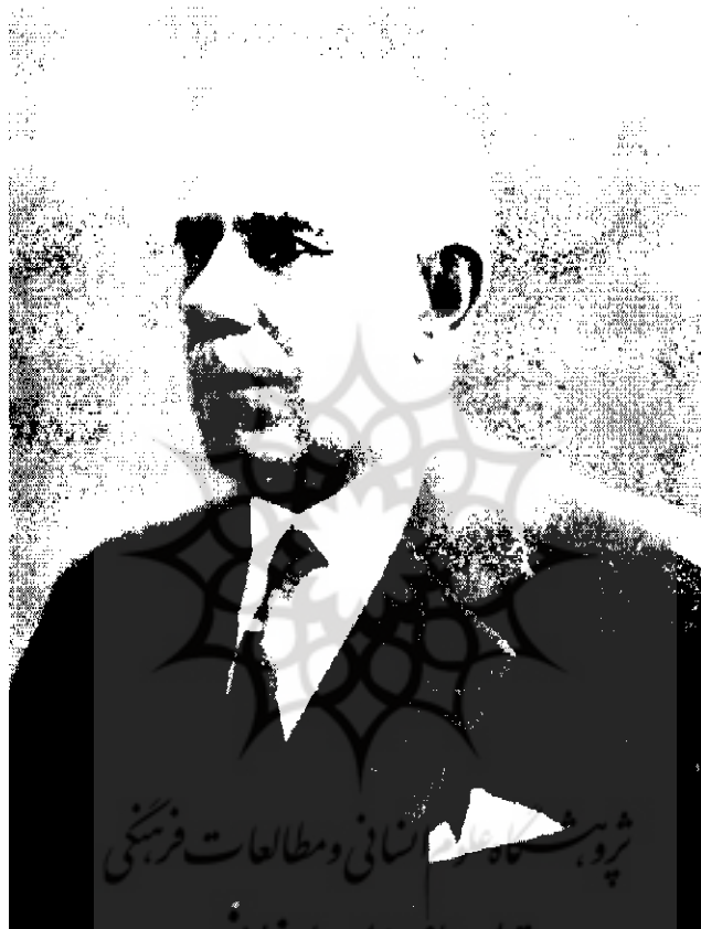
فتح الله خان اکبر رئیس الوزرای قبل از کودتای ۱۲۹۹ | ۴-۲۸۷م |

حاصل کرده بعد از عرض تبریک حضوری مختصر مطلبی که در نظر است به عرض برسانند. ایام مستدام