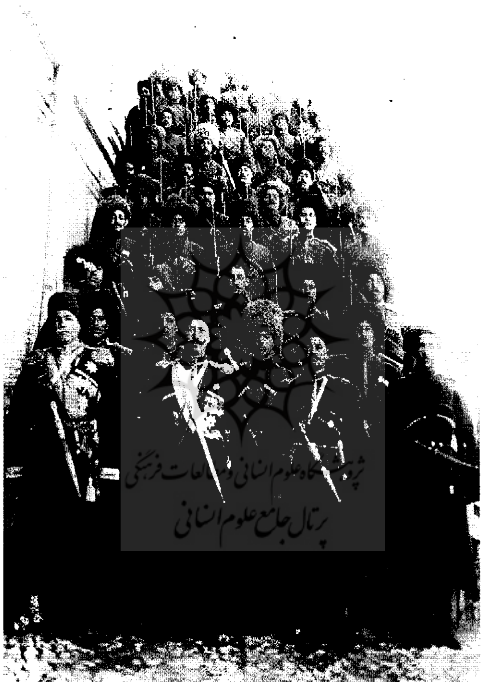
جمعی از فرماندهان و افسران ایرانی و روسی فزاقخانه | ۱-۶۵۲