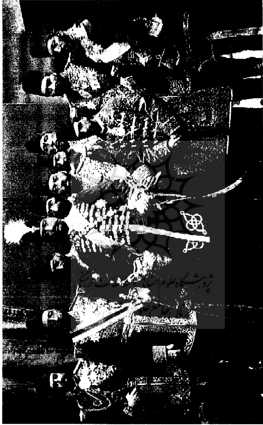
در تصویر از سمت راست: محمود قرآقچو، امامقلی میرزا عمادالدوله، عبدالصمد میرزا عزالدوله، فیروز میرزا نصرتالدوله، ابوالقاسم قرآقچو، حسین سبسالار، قزوینی، ناصرالدین‌شاه قاجار، علیقلی میرزا اعتضادالسلطنه، سلطان مراد میرزا حسامالسلطنه، حسینی گروس، میرزا ملکم ناظم‌الدوله | ۵۲-۲۲۳م]