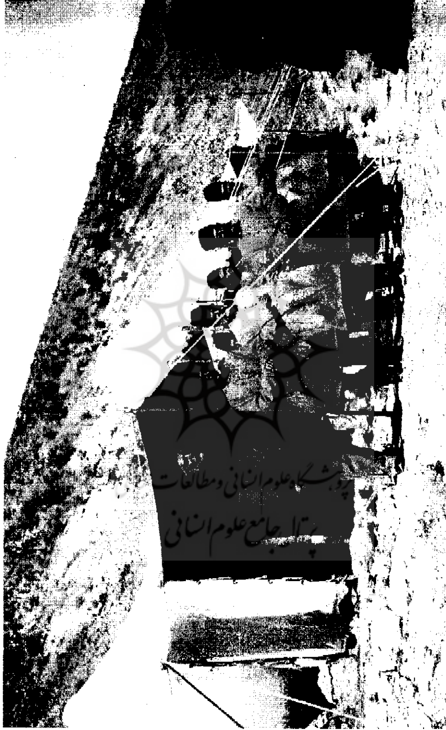
علمی امین الدوله و همراهان در جلوه آستانگاه خود در سر آبگرم اوجان | ۱۳۳۱۷-۱