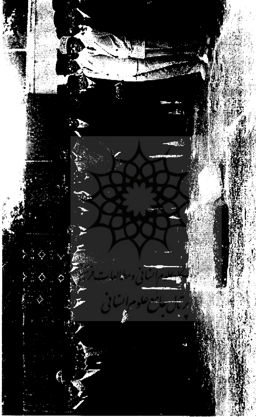
محمدعلی فروغی (دکاءالملک) رئیس الوزراء در جمع هیئت ریسبه و نمایندگان دوره نهم مجلس شورای ملی [ ۲۱۱۱-۴ ]