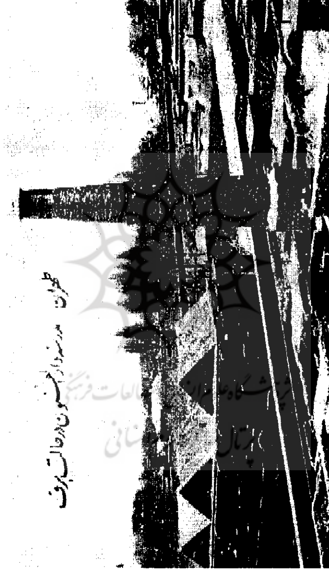
نمایی از مدرسه دارالفنون و مناطق اطراف آن در یک روز برفی | ۱۳۴۸-۱۳۴۹