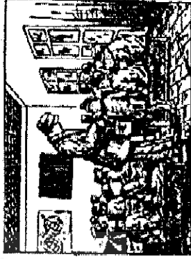
سنگ نما کردن عروب گیش مسجد

نمیزد است که در این روز و در این وقت بهشت است و در این وقت بهشت است