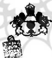
شکل ۷. سربرگ چاپی احمدشاه

پوشگاه علم از انان و مطالعات فرهنگی نظر برکت خصوص بوجه اول و کتاب پرتال جامع علوم از انان