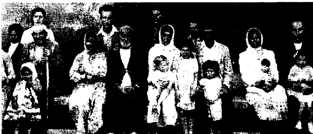
نخستین گروه از مهاجرین لهستانی

و پانزده هزار نفر از طریق ایران به نقاطی چون فلسطین، آفریقای جنوبی، آفریقای شمالی و دیگر نقاط آغاز شد. ۱۰ این افراد را ابتدا در بندر کراسنوتسک گرد آوردند. آنگاه به وسیله کشتی به بندر پهلوی انتقال دادند.