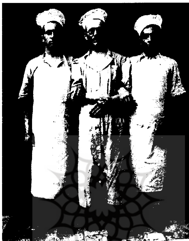
لهستانیهای مهاجر در اصفهان ۱۳۲۲ش

در ایران پدیدار شده و به تولید بهتر و بیشتر و حمل و نقل سریع‌تر در سراسر کشور مدد رسانیده بود.