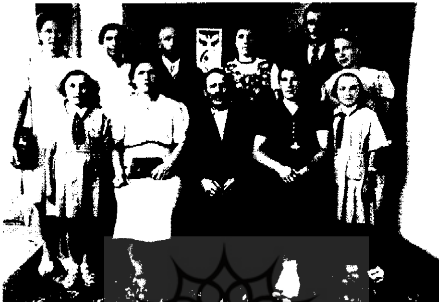
لَهستانیهای مهاجر در اصفهان ۱۳۲۲ش

اسکان لَهستانیها در تهران موجب گردید عده‌ای سودجو بدون در نظر گرفتن مسائل اخلاقی و بهداشتی با این افراد تماس پیدا کنند. لَهستانیها لباسهای کهنه و کثیف و برخی اشیاء دیگر خود را که معمولاً به انواع و اقسام بیماریها آلوده بود به این افراد می‌فروختند. اولیای دولت ایران با این گونه خرید و فروشها مخالف بودند. رؤسای لَهستانی نیز در صدد جلوگیری از این گونه ارتباطات بودند چرا که به این طریق (خرید و فروش) اولاً برخی بیماریهای مسری و خطرناک در جامعه شیوع می‌یافت. ثانیاً خریداران بومی ممکن بود کالاهای گرانبهای لَهستانیها را به بهای بسیار نازل خریداری نمایند. لذا سفارت لَهستان اشیاء گرانبهای غیرلازم این افراد را جمع‌آوری کرد و تحت نظارت خود و با اطلاع نمایندگان شهرداری در تهران به فروش رساند. افرادی که خارج از این حوزه عمل می‌کردند به وسیله دفتر مهاجران توقیف می‌شدند. ۹۴ عده‌ای از افراد بومی از طریق اهدای هدایا به مهاجران با آنها تماس برقرار می‌نمودند. چون این ارتباطات پیامدهای بدی می‌توانست به دنبال داشته باشد. هدایا را