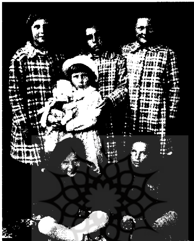
کودکان لهستانی در اصفهان ۱۳۲۲ش

البته دولتمردان ایران در مقابل خواسته‌های متفقین نمی‌توانستند چندان مقاومتی کنند. با وجود این، در تیر ۱۳۲۱ به متفقین اعلام کردند که با ورود لهستانیهای جدید، کشور بیشتر دچار کمبود مواد غذایی خواهد شد. اما وزیرمختار انگلیس پاسخ داد که خواروبار سربازان و مهاجران لهستانی کاملاً تأمین می‌گردد و آنان سربار دولت و ادارات دولتی ایران نخواهند بود! ۵۳