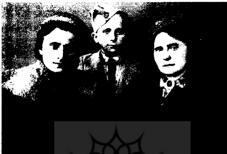
لهستانیهای مهاجر در اصفهان ۱۳۲۲ش

سانسور و نظارت بود تا جایی که بولارد سفیر کبیر انگلیس این را طی نامه‌ای به نخست‌وزیر وقت ایران از وی تقاضا می‌نماید. ۷۴ اما از آنجایی که اخباری نظیر اخبار مذکور به نفع متفقین بود روزنامه و کلیه جراید اجازه درج آنها را داشتند.