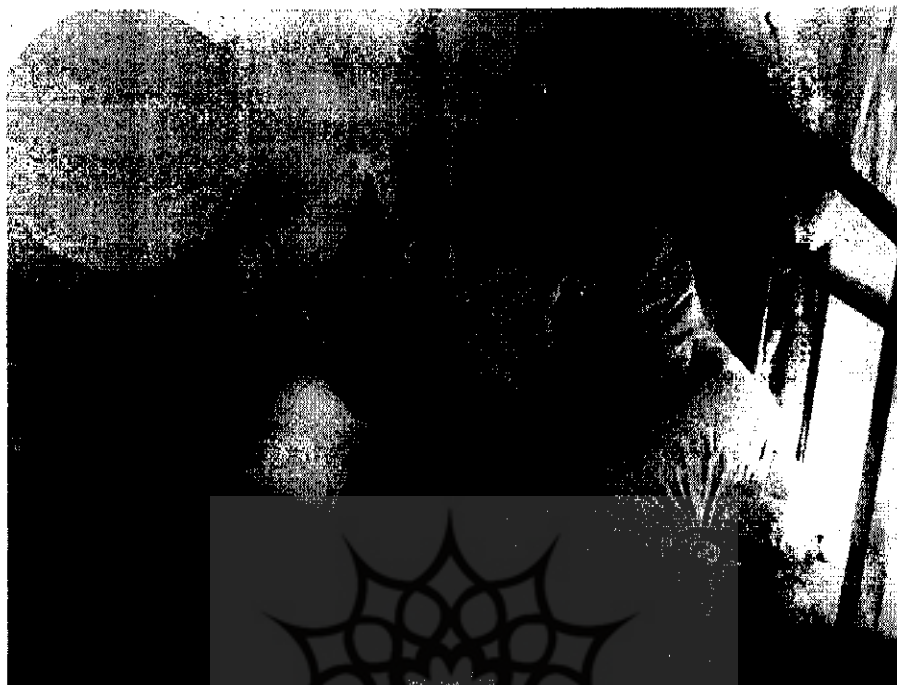
ملک الشعراء بهار در بستر بیماری | ۲۶۰۲-۴

اسم او به کار رفت - قوام السلطنه در زمانی که والی خراسان بود و او در عتقوان جوانی شعری ساخته و برایش خوانده بود به او داده بود. پدرش مرحوم شیخ علی بشرویه‌ای بود که من او را دیده بودم. فروزانفر در فن خودش استادی مسلم بود، سابقه طلبگی داشت، در جوانی شاگرد مرحوم میرزا عبدالجواد ادیب نیشابوری بود و در جلسات درس خود غالباً از او به بزرگی یاد می‌کرد. بعد به تهران آمد و لباس روحانی را ترک گفت و استاد دارالمعلمین عالی شد و بعد به دانشسرای عالی منتقل شد. خیلی کتاب می‌خواند، حافظه بسیار قوی داشت، آنچه را خوانده بود خوب به یاد می‌آورد. بارها در کلاس درس می‌گفت که این موضوع را در فلان کتاب، فلان چاپ و گاهی فلان صفحه خوانده‌ام. ما می‌رفتیم و مراجعه می‌کردیم، می‌دیدیم درست است. شواهد مثال و اشعار را در کلاس از بر می‌خواند، حتی پاره‌ای از متون عربی را مثلاً رحله ابن جبیر از برداشت. پاره‌ای از متون شغای ابوعلی سینا را هم از بر می‌خواند.