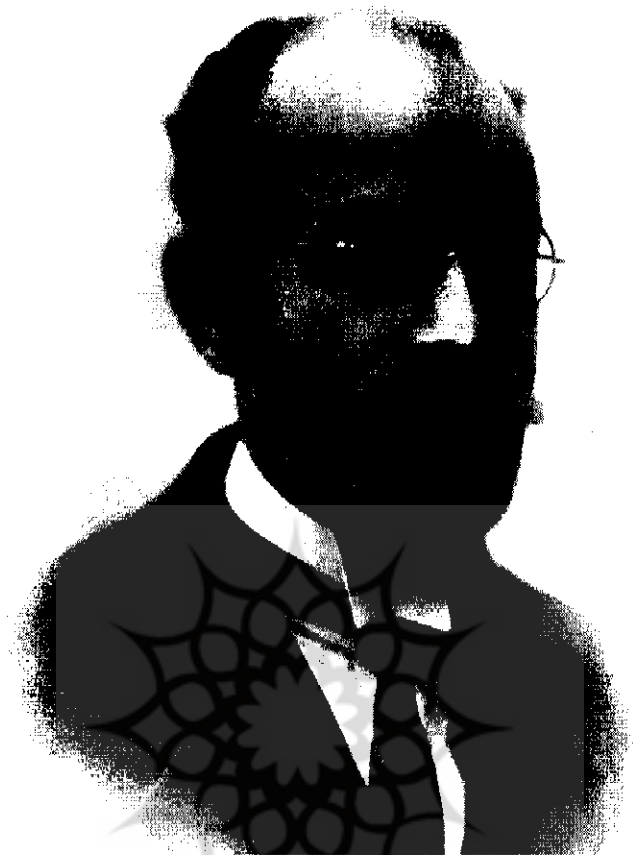
ابوالحسن فروغی [ ۱-۲۷۷۸ ]

می‌دادند و درحقیقت باید گفت که میرزا احمدخان بدر، به منظور تعلیم و تربیت معلم زن، آن مدرسه را به دارالمعلمیات تبدیل کرد. اقدامات وی موجب شد که دو نفر از شاگردان این مدرسه هفته‌ای سه روز برای یاد گرفتن فنون و دروس مربوط به بیماریهای زنان و فن قابلمگی به بیمارستان نسوان بروند. زیرا در آن روزگار مامای تحصیل کرده وجود نداشت و عمل زایمان به کمک زنانی صورت می‌گرفت که به صورت سنتی این دقایق را از ماماهاى سنتی، خاصه از مادران خود یاد گرفته بودند و تنها در زایمانهای آسان می‌توانستند مفید قرار گیرند و عمل میرزا احمدخان بدر مقدمه‌ای بود برای ایجاد تشکیل رشته مامایی در دانشکده طب. ۳