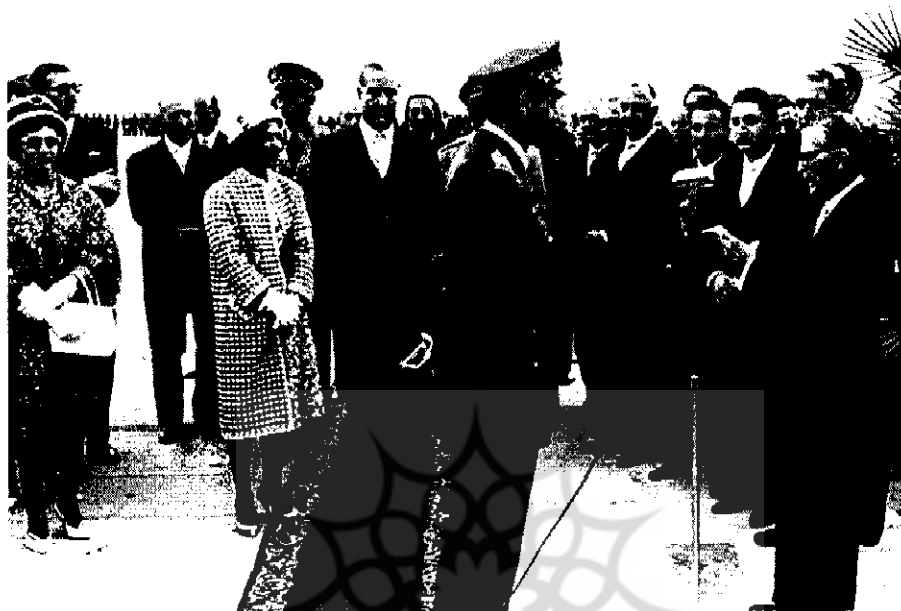
محمد رضا پهلوی هنگام استماع گزارش حسین علاء وزیر دربار [۱۰۶۷ - ۱]

مجلس سپری شده است؛ اینک باید مجلس را به کسوت زیبای انتخابات آراست زیرا راه از بین بردن یک جریان، ایستادن در مقابل آن جریان نیست بلکه منحرف کردن آن به مسیر مورد نظر است. علاء در جای دیگر می نویسد: