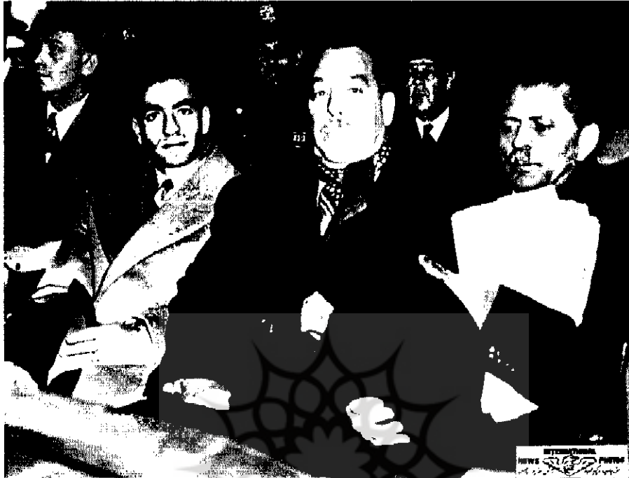
حسین علاء و دین آچسن | ۲۴ - ۱ - پ |

این قرار گرفته است که در امور داخلی ایران دخالت نکنیم. ۱۱ سفیر انگلیس، ضمن اینکه با اظهار این جمله به دخالت انگلیس در امور داخلی ایران اعتراف می‌کند، می‌افزاید: