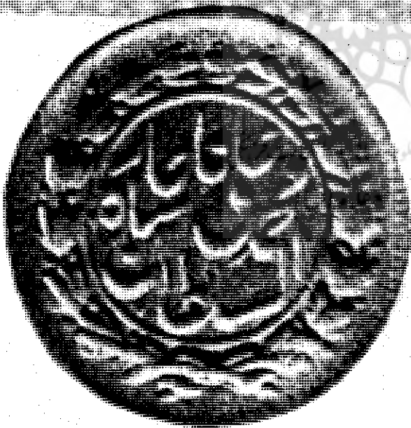
يك سكه طلا از محمدعليشاه قاجار است بطوريكه ملاحظه مي شود بجاي رقم ۲۶ (۱۳۲۶) رقم ۶۲ حك شده است