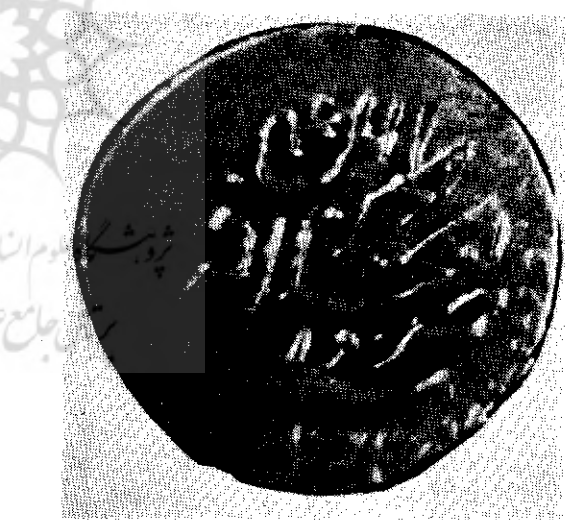
دو نمونه از سکه های شیرخوابیده با تاریخ صحیح آن ها