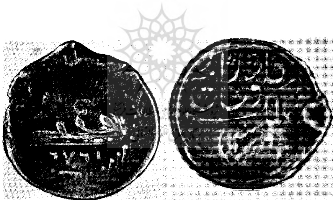
دو نمونه از رو و پشت سکه‌های شیروخورشید است که تاریخ ضرب ۱۲۷۲ و ارونه حک شده است