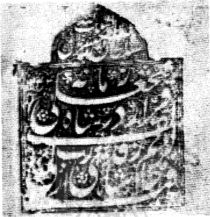
الملک الله سلطان صاحب قران

بِسْمِ اللَّهِ تَعَالَى شَاهِ الْعَزِيزِ