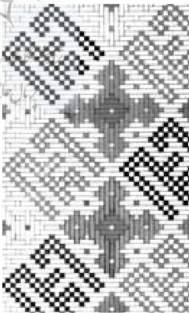
کتاب ماه هنر / فروردین / ولادتیهشت ۱۳۸۰ - ۱۰۶