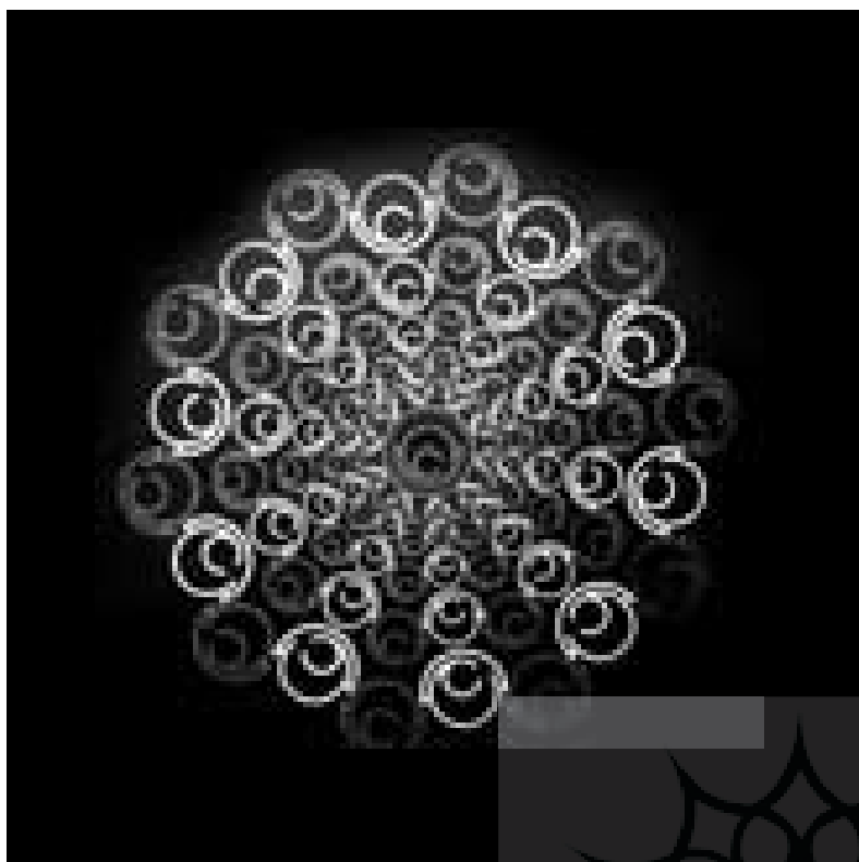
شکل - ۳

در بناهاست. هم‌چنین در اثر دیگری از همان استاد کلمه علی به شکل دواپر متحدالمركز به صورت شمسه از وحدت به کثرت اجرا شده این شیوه اجرای نقش با نگارش کلمه علی در آجرکاری و کاشی‌کاری و گچبری و نقاشی در بناها و هم‌چنین آثار منبت‌کاری، خاتم و قلمزنی و بافت پارچه‌های زری و غیره کاربرد دارد. در این نقش ۱۰۱ کلمه علی (ع) نگارش شده یافته است. نگارش کتیبه‌ها به شکل دواپر متحدالمركز از شیوه وحدت به کثرت و از کثرت به وحدت رسیده است و رنگ‌های آبی و زرد اخراپی و قرمز اخراپی کمرنگ در آن اجرا شده است (شکل ۳)