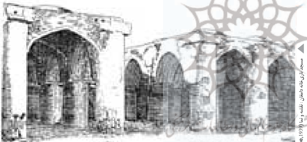
مسجد تاری‌خانه دامغان: نقشه و بنا (Pope, 1939)