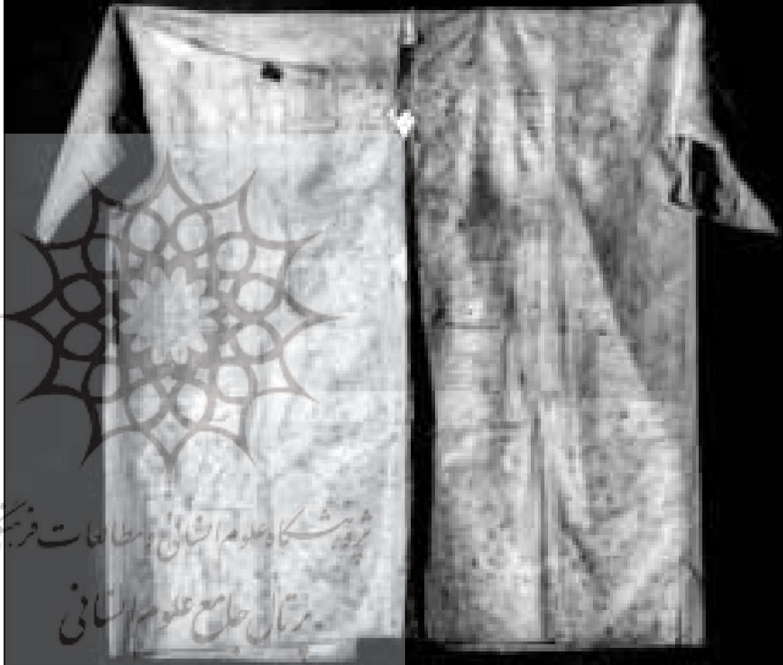
پیراهن فتح (آیه الکرسی)، مربوط به شاه عباس اول

جامه‌هایی که اکثراً به شکل بلوزهای گشاد (تونیک) هستند و بنابر شواهد موجود و وجود نمونه‌های مختلف که مربوط به دوره‌ی صفویه و قاجاریه می‌شوند، در زمره‌ی این گروه قرار می‌گیرند و کاملاً جنبه‌ی تعویذ دارند. بر سراسر این البسه در ترکیبی از نقوش و طرح‌های هندسی و گیاهی و گاه اسلیمی، به خطوط مختلف مانند کوفی، نسخ، ثلث،