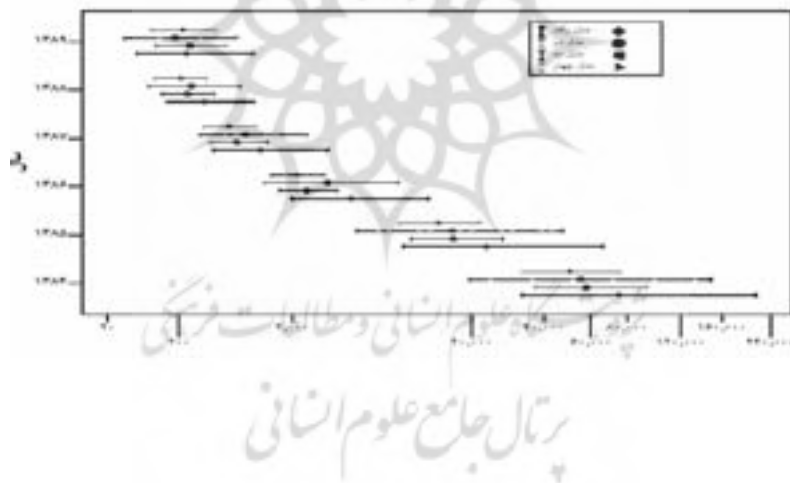
شکل ۴. مقایسه بازه اطمینان مبالغ خسارت معوق در مدل‌ها به تفکیک سال (ارقام به میلیون ریال)

با توجه به شکل‌های ۳ و ۴ مشاهده می‌شود که بازه اطمینان به دست آمده برای مدل‌های ۲ و ۴ دارای طول کم‌تر و در نتیجه احتمال پوشش بیشتری است. به نظر می‌رسد مدل ۲ و ۴ در مقایسه با مدل‌های ۱ و ۳ بهتر عمل کنند و البته با در نظر گرفتن این موضوع که در مدل‌های ۲ و ۴ تعداد تصادفات نیز در مدل‌بندی استفاده شده است می‌توان نتیجه گرفت که این امر باعث بهبود برآورد در مدل‌ها گردیده است.