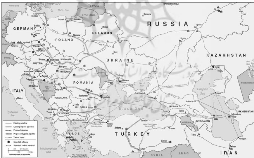
شکل ۲. نقشه خطوط صادرات گاز روسیه به اروپا.

اصلی‌ترین خطوط لوله صادرات گاز پیش‌بینی شده روسیه در آینده در جدول زیر مشاهده می‌شود: