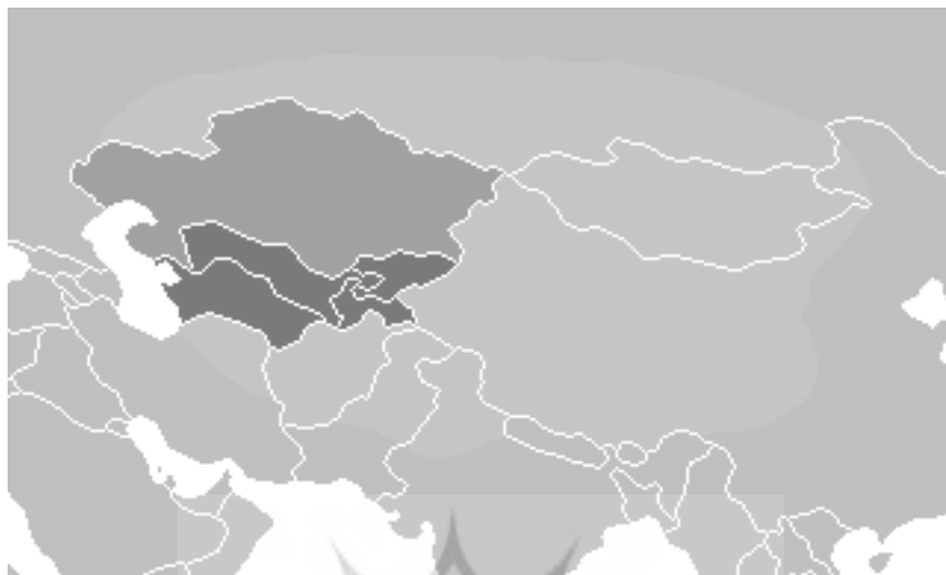
شکل ۱. ناحیه آسیای میانه بر مبنای ۳ تعریف مختلف

کشورهای آسیای میانه دارای منابع مناسب انرژی هستند، به عنوان نمونه ترکمنستان دارای منابع گاز و نفت بوده و تاجیکستان نیز توانایی صادرات برق دارد. اما با توجه به مشکل محصور بودن در خشکی‌ها، این کشورها توانایی صادرات مستقیم حامل‌های انرژی را نداشته و نیازمند حضور یک واسطه در جهت صادرات جهانی هستند. از این رو کشورمان می‌تواند با دسترسی به آب‌های آزاد زمینه‌های لازم را برای تحقق این امر فراهم کند.