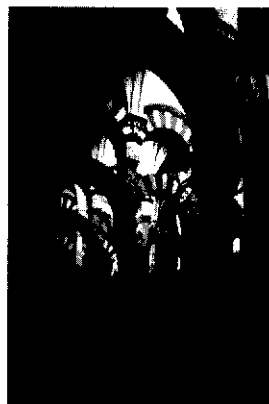
۲- میزان فی تفسیر القرآن، جلد ۸، ص ۶۱، علامه سید محمد حسین طباطبائی.

«آنها به طلب دانش از غیر اوصیاء پیامبر صلی الله علیه و آله پرداختند و آنچه را به آنها گوشزد شده بود فراموش کردند و بدان سبب آنان قسمتی از قرآن را با قسمتی دیگر رد کرده اند، به منسوخ احتجاج کرده اند، به پندار اینکه ناسخ است، به متشابه احتجاج کرده اند به این اعتقاد که محکم است، به خاص تمسک کرده اند و گمان کرده اند