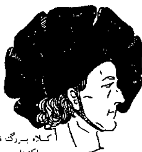
کلاه بزرگ از سند چاک‌دار و حاشیه کنگرهای متصل به کلاه. کوچک، بند زیرچانه، متصل به کلاه.

Minimum system requirements: Win 95 or Later, 16 MB RAM, 16XCD-ROM, 2MB graphics card 16-bit sound card, Best View in: High color (16 bit)