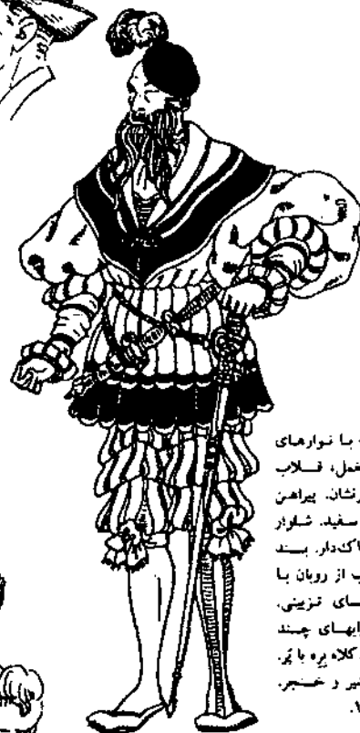
نیم‌تنه با نواریهای مخمل، قلاب جواهر نشان. پیراهن کتان سفید. شلووار چاک‌دار. بند جوراب از روبان با مهره‌های تزئینی. جسورهای چند رنگ. کلاه پره یا پر شمشیر و خنجر. ۱۵۴۸