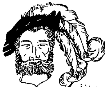
کلاه پیره یا لینه چاک‌دار و پر شتر مرغ