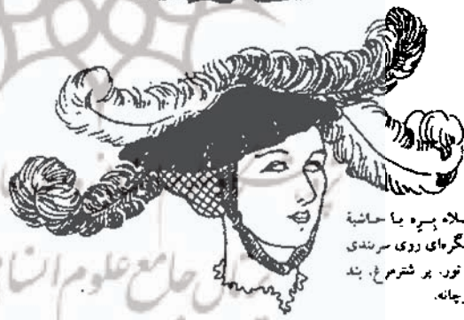
کلاه پیره یا حاشیه کنگرهای روی سر بندی از نور. پر شتر مرغ. بند زیرچانه.

در نمایشگاه‌های گروهی و انفرادی نقاشی، همکاری در کتابشناسی تفصیلی هنر ایران در دانشگاه هنر، پژوهش در لباس ایرانیان، ترجمه و نگارش مقاله‌های تحقیقی در نشریات آموزشی و هنری و آرایه طرح‌های پژوهشی به رسانه‌های گروهی است.