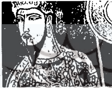
امانگلدی ضمیر ۱۳۷۵

سازمان میراث فرهنگی کشور میراث فرهنگی استان خوزستان پژوهشهای مردم شناسی