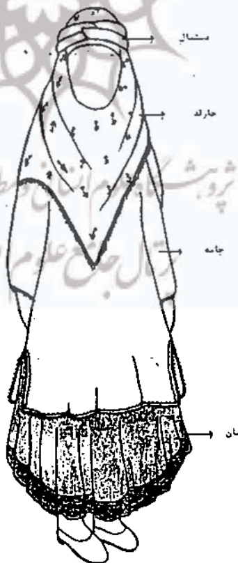
پوشش کامل زنان عباس آباد