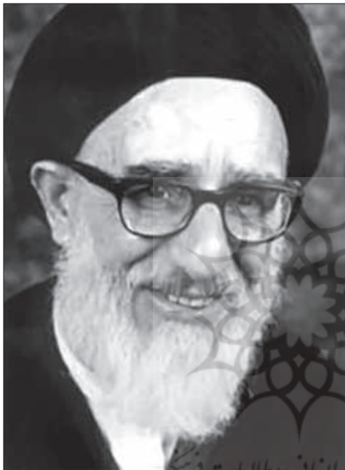
آیت‌الله سید محمود طالقانی

شمس‌الدین امیرعلایی نیز در خاطرات خود می‌گوید: «من صبح زود بعضی از دوستان هم فکرم را دعوت کردم که به منزل من بیایند که به همراه هم به خانه آیت‌الله طالقانی برویم. ده نفر از یارانم از جمله آذر، رفیعی، دژکام و... آمدند و با هم رفتیم خانه آیت‌الله طالقانی. دکتر کریم سنجابی