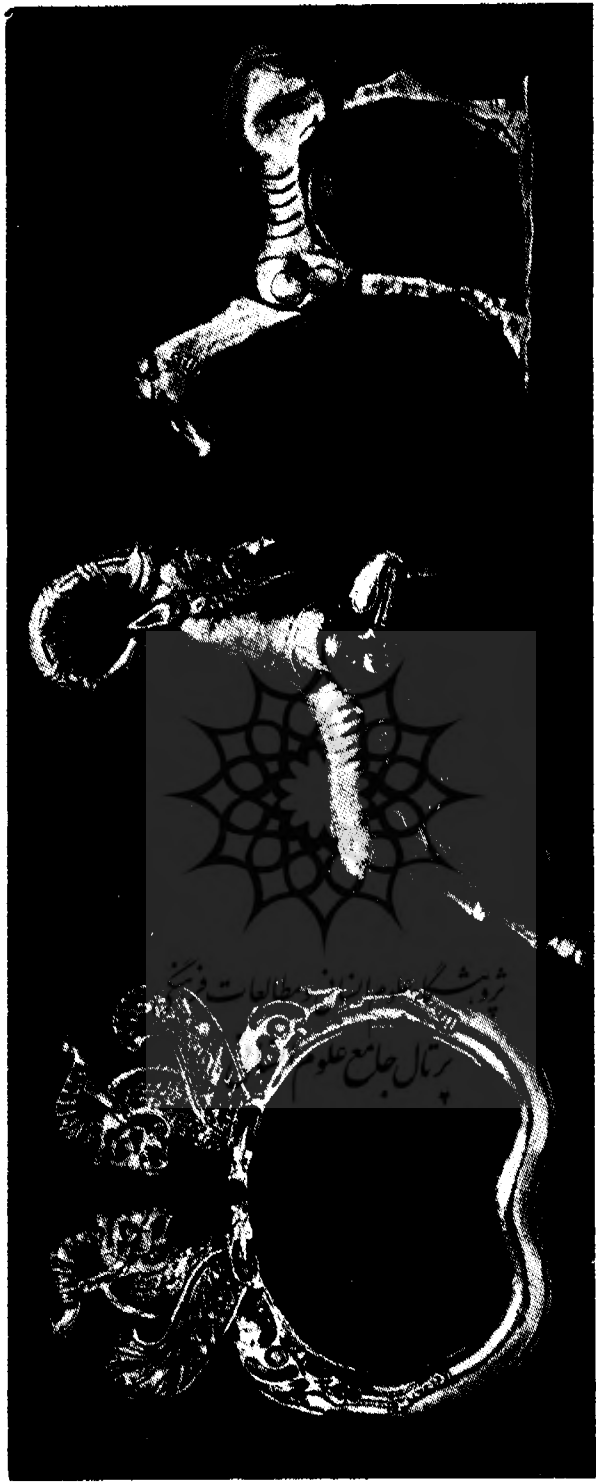
شکل ۸ - سه اثر از کتیبه جیخون در موزه بریتانیا (لندن) مربوط به هنر هخامنشی