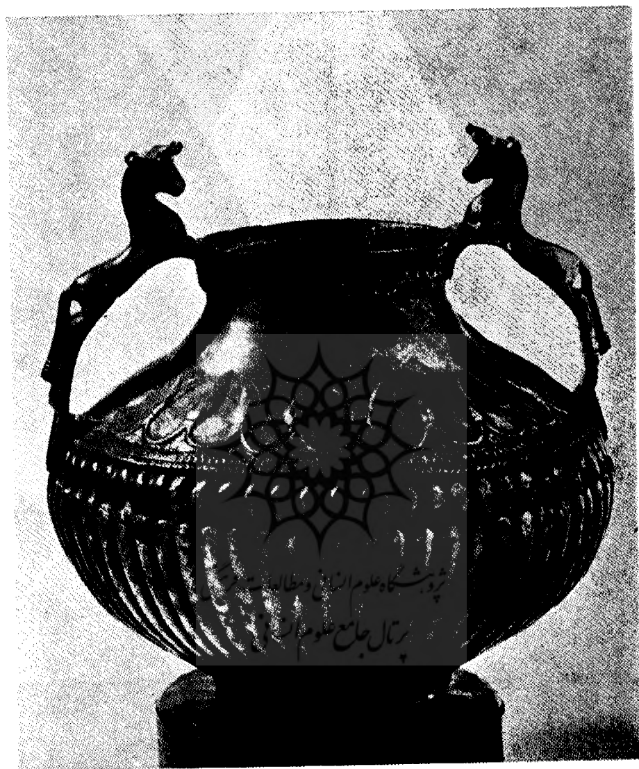
شکل ۷- ظرف نقره‌ای که دسته‌هایی بشکل مجسمه گاودارد عکس از

Kunstschatze aus Iron, Wien 1963, p. 55 katalog 182.