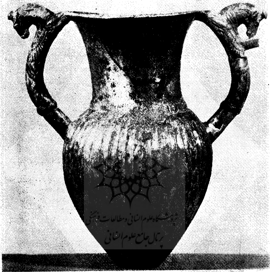
شکل ۵ - گلدان نقره‌ای مربوط به هنر هخامنشی متعلق به مجموعه خصوصی بی‌ال (سوئیس)