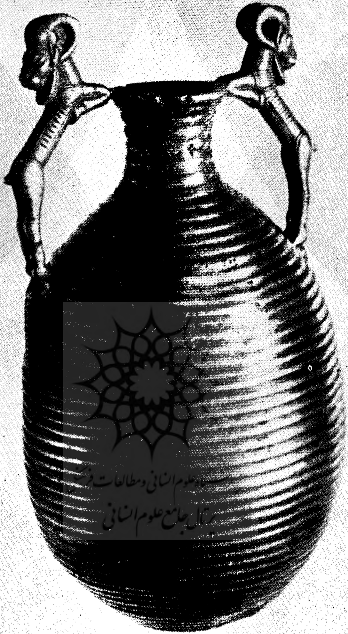
شکل ۶- گلدان نقره‌ای شبیه بکوزه تخم مرغی شکل با شیارهای افقی و موازی مربوط به هنر هخامنشی در موزه ایران باستان تهران