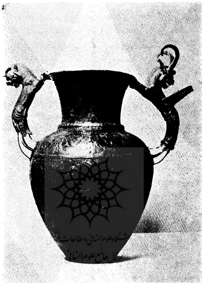
شکل ۱ - گلدان نقره‌ای مربوط به هنر هخامنشی در موزه ملی باستانشناسی صوفیه ( بلغارستان ) عکس از نگارنده .