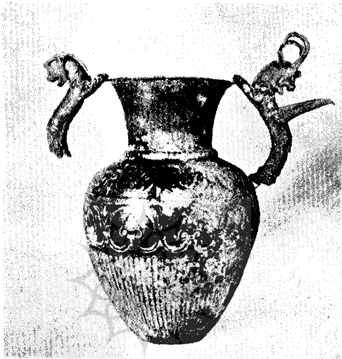
شکل ۲- همان گلدان نقره‌ای قبل از تعمیر در سال ۱۹۳۸