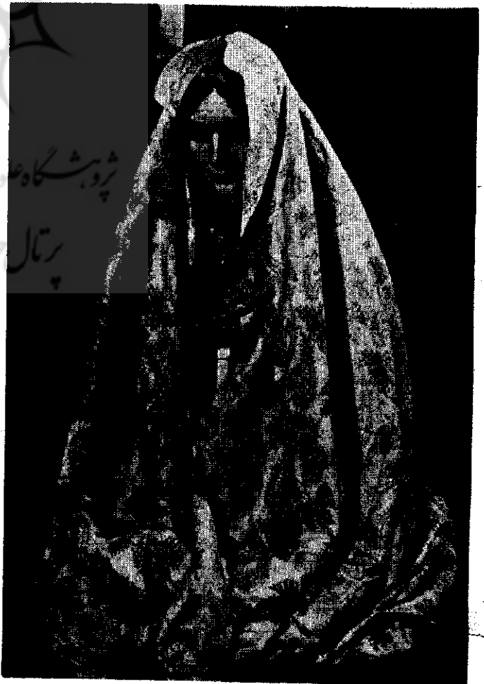
زنی با چادر گلداز