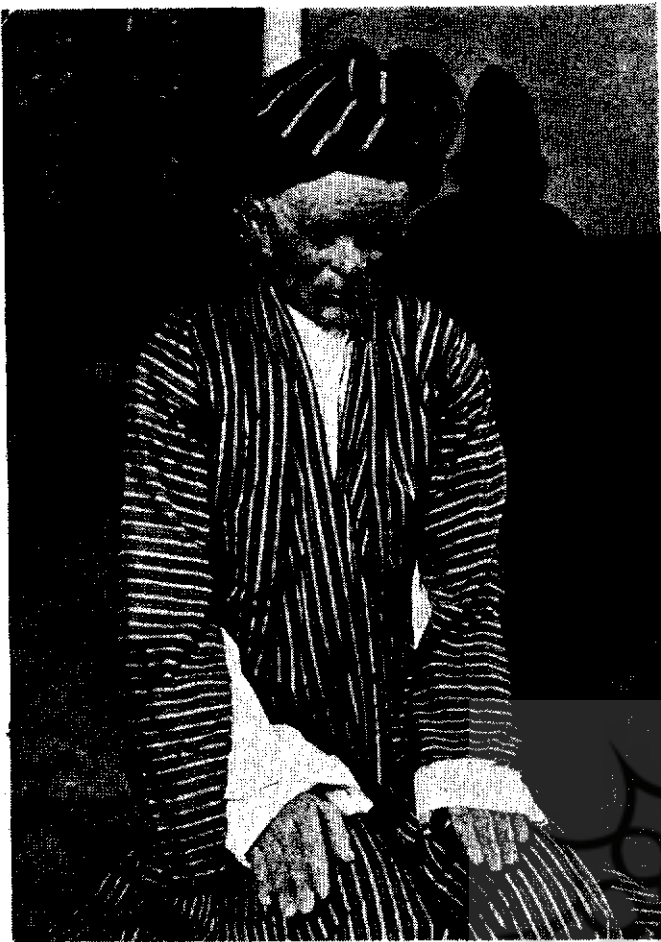
يك مرد در لباس قديم

ساختمان موزه مردم‌شناسی یکی از بناهای قدیمی تهران است که در اوایل قرن چهاردهم هجری قمری ساخته شده است. در حدود بیست و پنج سال پیش بامر اعلیحضرت ققید ، وزارت فرهنگ درصدد ایجاد موزه مردم‌شناسی برآمد و برای این امر به تمام ادارات فرهنگ نواحی مختلف کشور دستور داده شد که اطلاعات و اشیاء مربوط به زندگی مردم نواحی مختلف ایران را جمع‌آوری و بمرکز ارسال دارند . باین ترتیب پایه و بنیاد موزه مردم‌شناسی ایران ریخته شد و در سال ۱۳۱۷ رسماً افتتاح گردید . لکن در اثر عدم توجه و نبودن متخصصان علم مردم‌شناسی و موزه‌داری این موزه کم‌کم بصورت انبار کالا درآمد و مانند دکانهای سمساری بدون رعایت اصول از اشیاء گوناگون انباشته شد در حالیکه اشیاء و اطلاعات گردآوری شده برای ایجاد موزه‌ای که از هر نظر بی‌عیب و نقص باشد تناسب زیادی نداشت .