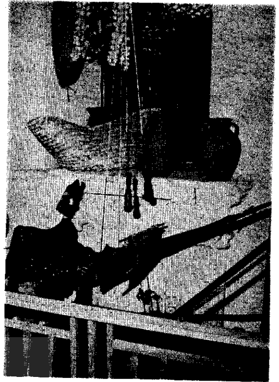
زن گیلانی در حال بافتن چادر شب