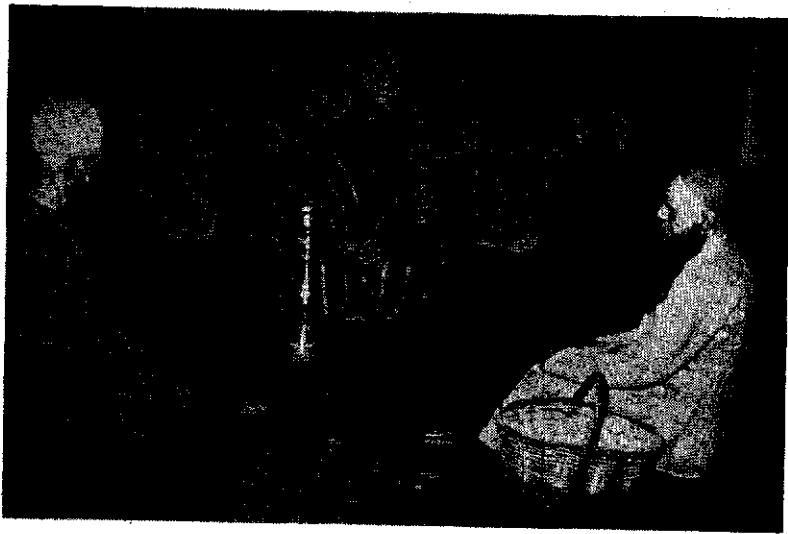
مجلس ارباب ورعیت مربوط به اوایل قرن ۱۴ هجری قمری

دانش پژوهان جوان بنواحی مختلف کشور در امر گردآوری فولکلور و وسایل زندگی مردم ایران و نمایش گذاشتن آنها، تحول عظیمی بوجود آورده است.