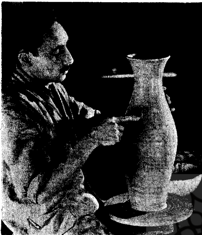
صاف کاری بدنه کوزه بدست یکی از هنرمندان کارگاه کوزه‌گری

در دوره اعلیحضرت رضا شاه کبیر وقتی لزوم احیای صنایع مستظرفه احساس شد کارگاه کاشی سازی نیز تاسیس گردید و از شش سال پیش جنبشی برای پیشرفت دادن هنر سرامیک در هنرهای زیبا آغاز شده است که نتایج آن بتدریج بدست میآید.