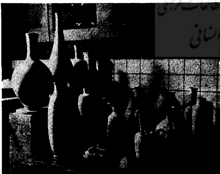
مجموعه‌ای از کوزه‌ها قبل از رفتن بکوره