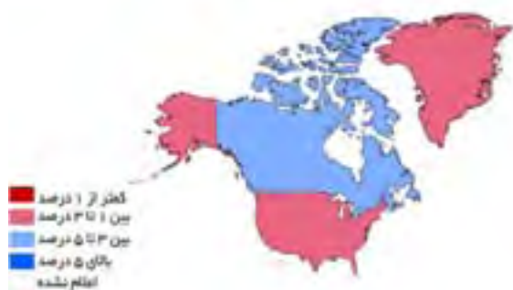
متوسط رشد اقتصادی آمریکای شمالی طی سال‌های ۲۰۱۰ تا ۲۰۱۱