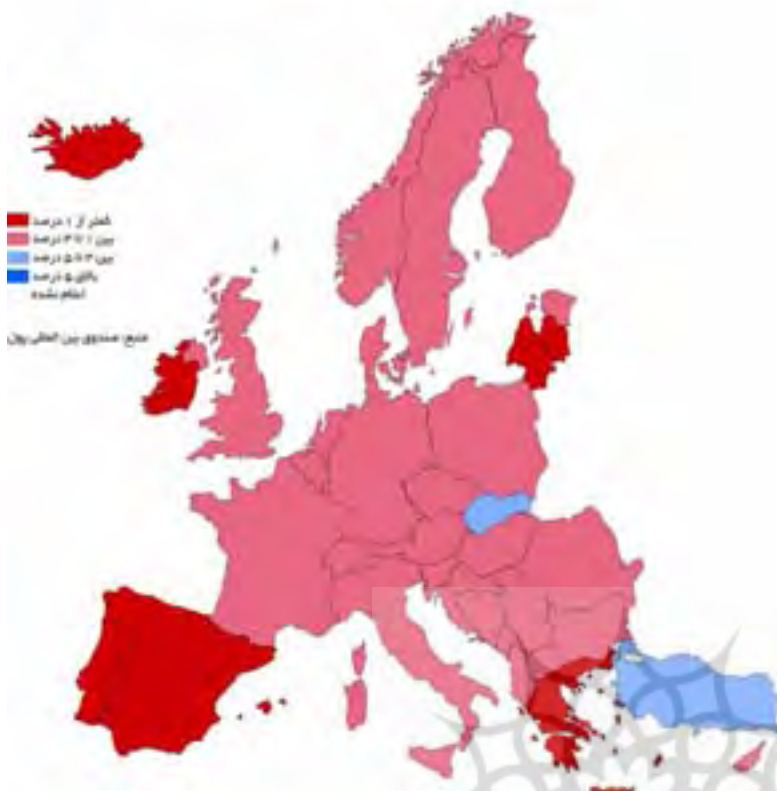
متوسط رشد اقتصادی اروپا طی سال های ۲۰۱۰ تا ۲۰۱۱

اروپا برای خروج از ورطه رکود دشواری‌های زیادی دارد؛ چه اینکه رشد کشورهای پیشرفته اروپایی در سال ۲۰۱۰ و ۲۰۱۱ به ترتیب ۱ و ۱٫۷ درصد پیش‌بینی می‌شود اما رشد اقتصادی منطقه یورو کمتر برآورد شده است، به گونه‌ای که رشد اقتصادی کشورهای عضو پول واحد اروپایی در سال جاری میلادی ۱ و در سال آینده ۱٫۵ درصد پیش‌بینی می‌شود. اقتصاد کشورهای آلمان (۱٫۲ و ۱٫۷ درصد)، فرانسه (۱٫۵ و ۱٫۸ درصد)، ایتالیا (۰٫۸ و ۱٫۲ درصد)، اسپانیا (۰٫۴- و ۰٫۹ درصد) و هلند (۱٫۳ و ۱٫۳ درصد) در سال‌های ۲۰۱۰ و ۲۰۱۱ رشد خواهد کرد. کشورهای بلژیک، یونان، اتریش، پرتغال، فنلاند، ایرلند، اسلواکی، اسلونی، لوکزامبورگ، قبرس و مالت در سال‌های ۲۰۱۰ و ۲۰۱۱ رشدی بین ۱ تا ۳ درصد را تجربه می‌کنند. خارج از منطقه یورو هم رشد اقتصادی انگلیس، سوئد، سوئیس، جمهوری چک، نروژ، دانمارک و ایسلند هم مانند کشورهای منطقه یورو رشد اقتصادی بیش از ۳ درصد را تجربه نخواهند کرد. اما پشت دروازه اروپا کشورهای چون ترکیه، لهستان، رومانی، مجارستان، کرواسی و استونی رشد اقتصادی اندکی بهتر از اعضای اتحادیه اروپا را شاهد خواهند بود. آیا یورو با این اوضاع و احوال راهی برای نجات خویش پیدا خواهد کرد؟ دست کم اینکه پیروزی دولت‌های ملی‌گرا در برخی کشورهای اروپایی زنگ خطری برای اتحادیه است و بیم آن وجود دارد که اغراق برخی کشورهای تازه به یورو ملحق شده، دربارہ توان اقتصادیشان بحران را بغرنج‌تر کند.