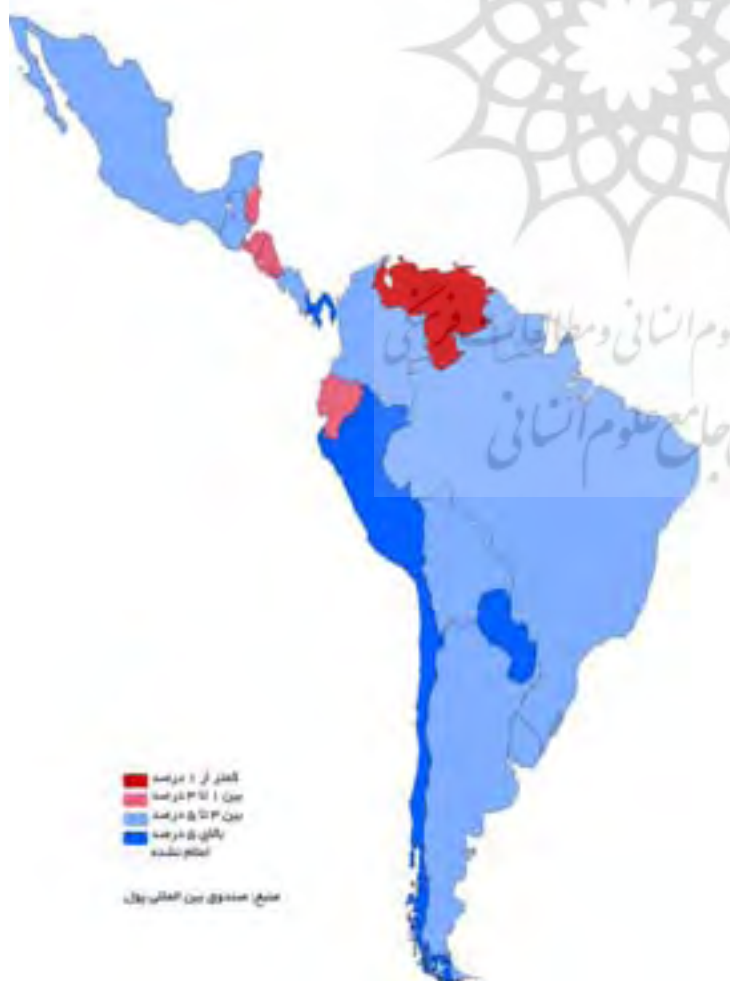
متوسط رشد اقتصادی آمریکای لاتین و منطقه کارائیب طی سال‌های ۲۰۱۰ تا ۲۰۱۱