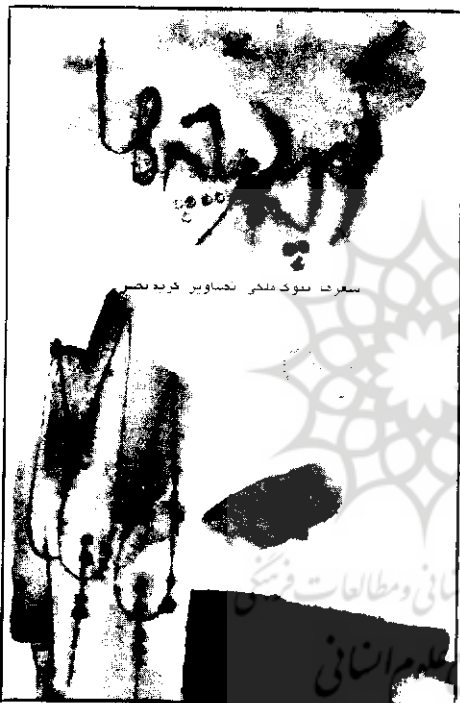
سفرت نبودنمخ تصاویر خردبصر

در این میان، تلاش برای خلق تصاویر شعری تازه، گاه به ایمازهایی انجامیده است که به دلیل نقص دانش شاعر درباره عناصر سازنده تصاویر، ما به ازای خارجی درستی ندارند و از خطای شاعر برده بر می‌دارند.