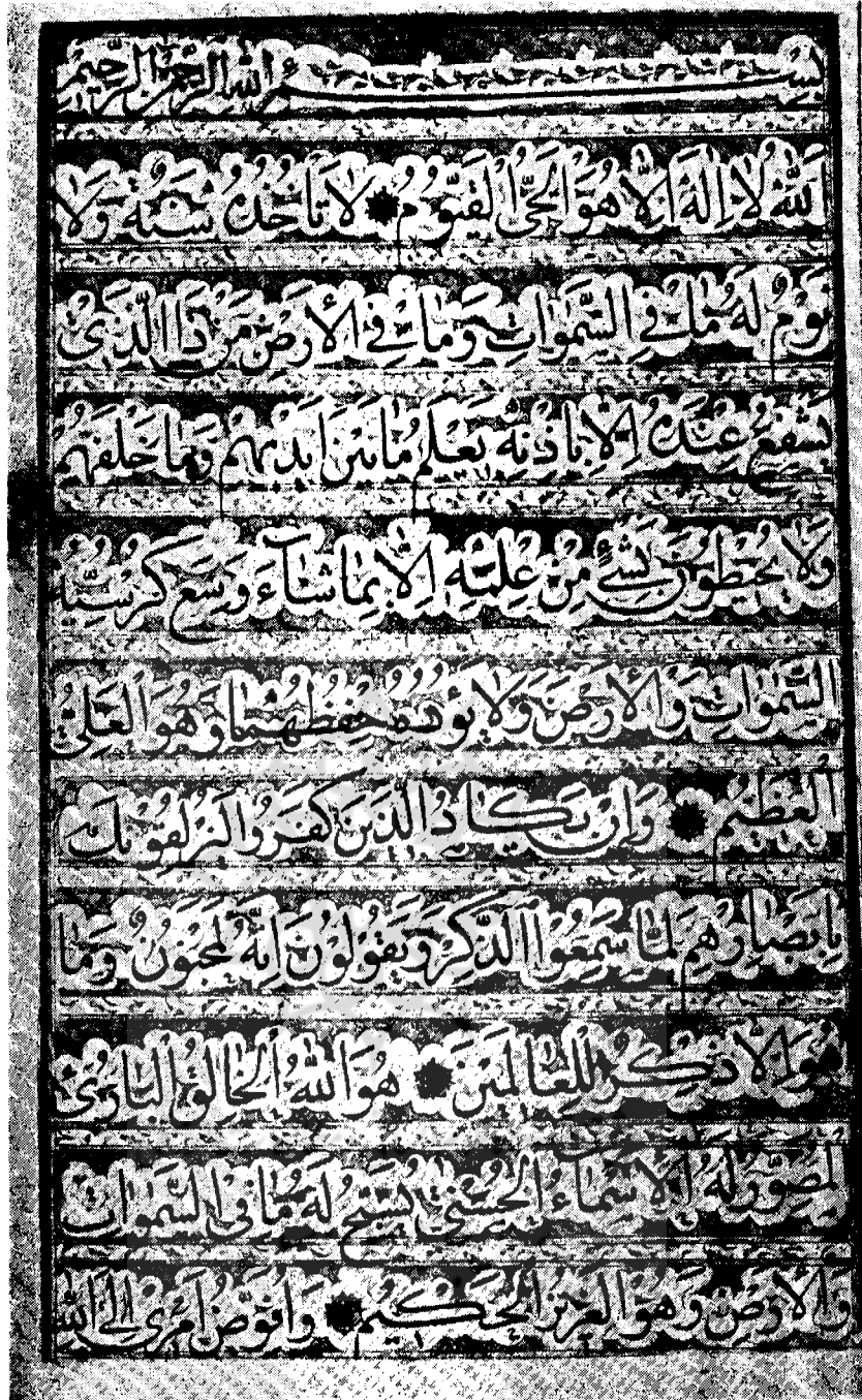
خط نسخ مرحوم آقا میرزا عبدالحسین قدسی رحمه الله . این قطعه را مرحوم قدسی در سال ۱۳۰۹ هـ ق. بتقلید از خط آقا زین العابدین اشرف الکتاب نگاشته تذهیب آن نیز کاملا باتذهیب قطعه خط اشرف همانند است .