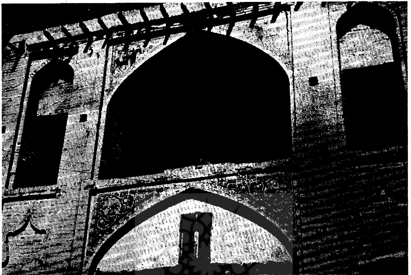
تصویری از نمای قسمت وسط طبقه دوم بنای کاروانسرای وزیر

سرای حاجی‌رضا - سرای ضرابخانه - سرای حاجی سیدکاظم - مجموعه‌ای ارزنده سرای سعادت یا سعدیه - کاروانسرای شاه و بالاخره سرای وزیر. برای آنکه در این بحث توجه خوانندگان عزیز را به گونه‌ای روشن به ارزش و اعتبار این آثار جلب ساخته باشیم در زیر به توصیف سرای وزیر که از سراهای معروف قزوین است میپردازیم، باین امید که مقامات مسئول برای تعمیر و حفظ این اثر تاریخی و هنری اقدامی اساسی معمول دارند.