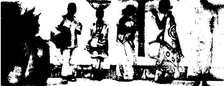
«موجا یعنی یک»، نمونه یک کتاب عددآموز، تصویرگر: تام فیلپکز

The clothing East Africans wear includes the kanga, bunsi, lapa, kanzu, and dashiki.