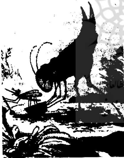
مخبر در چاده، نمونه یک کتاب تصویری آسان خوان، متن تصویر، آرنولد لوبل

بنابراین، اصطلاح «کتاب‌های تصویری» طیف وسیعی از کتاب‌های کودکان را در بر می‌گیرد، از کتاب‌های نته‌غازه و کتاب‌های اسباب‌بازی برای