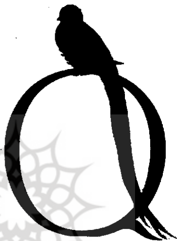
حروف الفبا یا حروف‌تات به نمایش درآمده‌اند. برگرفته از کتاب الفبای جانوران، تصویرگری: پرت پیچون

تفاوت بارز الفبای آموزهای بچه‌های کوچک و طیف وسیعی از الفبای آموزهای مخصوص کودکان بزرگ‌تر، اشاره می‌کند و می‌نویسد: