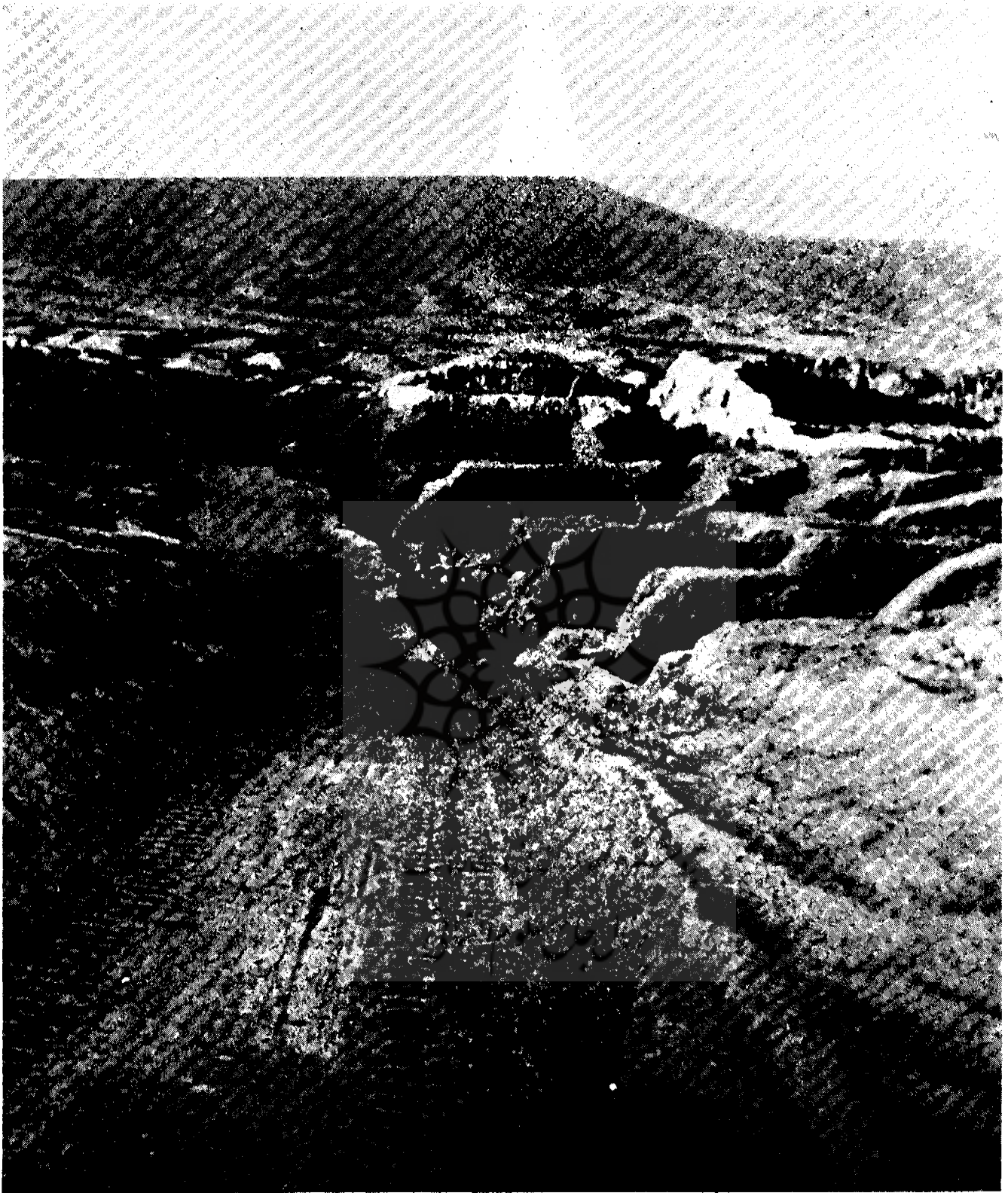
تصویر یکی از کوچه‌های شهر باستانی پنج‌کنت بعد از کاوش.