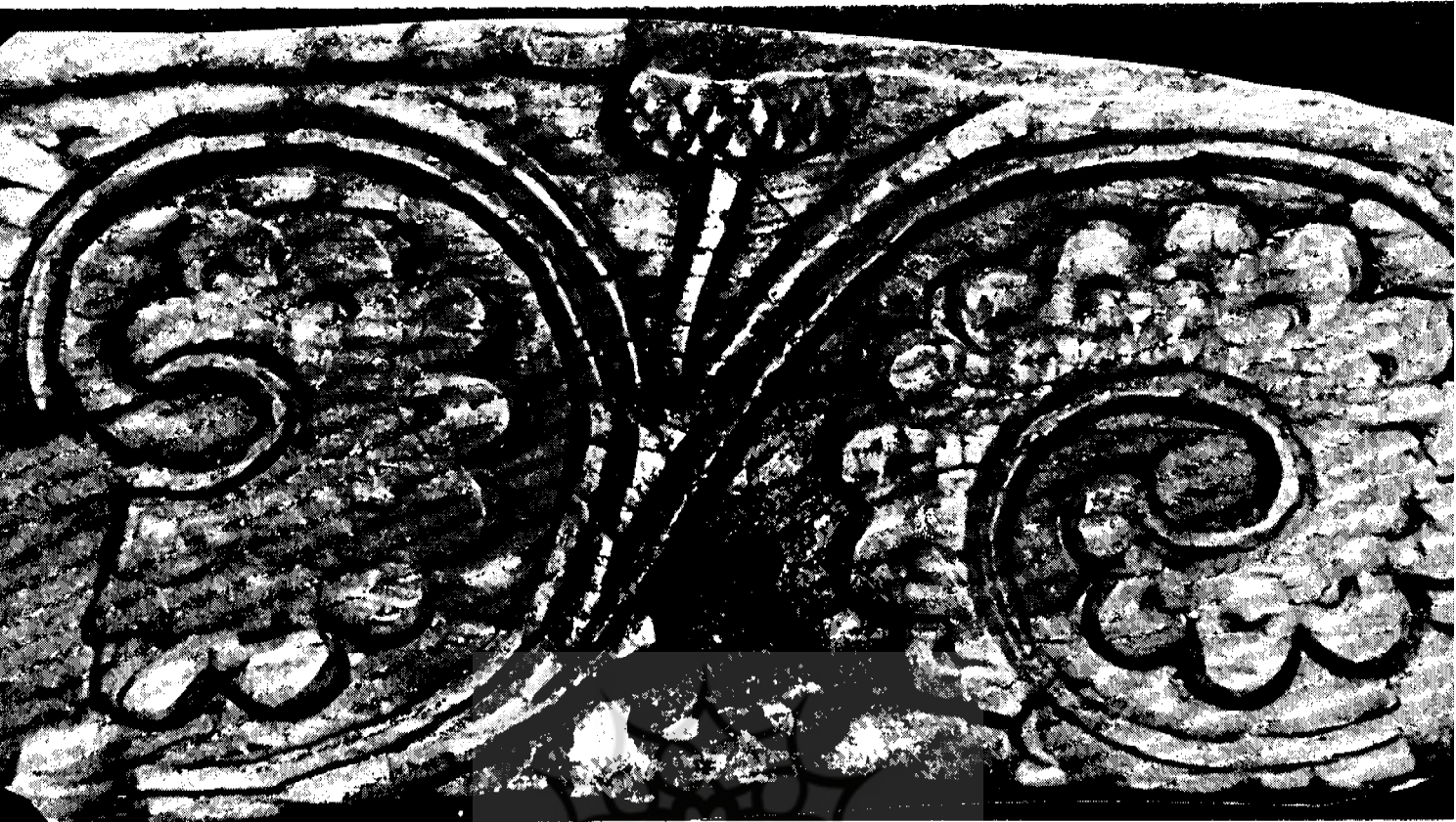
قطعه‌ای دیگر از چوبهای کنده‌کاری شده مربوط به تزئینات پنج‌گت.