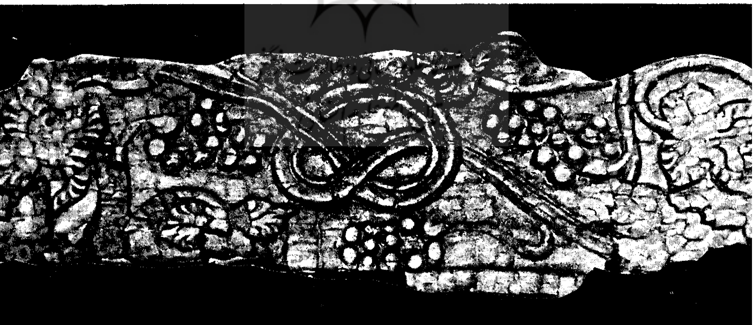
یک قطعه چوب کنده‌کاری شده مربوط به تزئینات داخلی بناهای پنج‌گت.