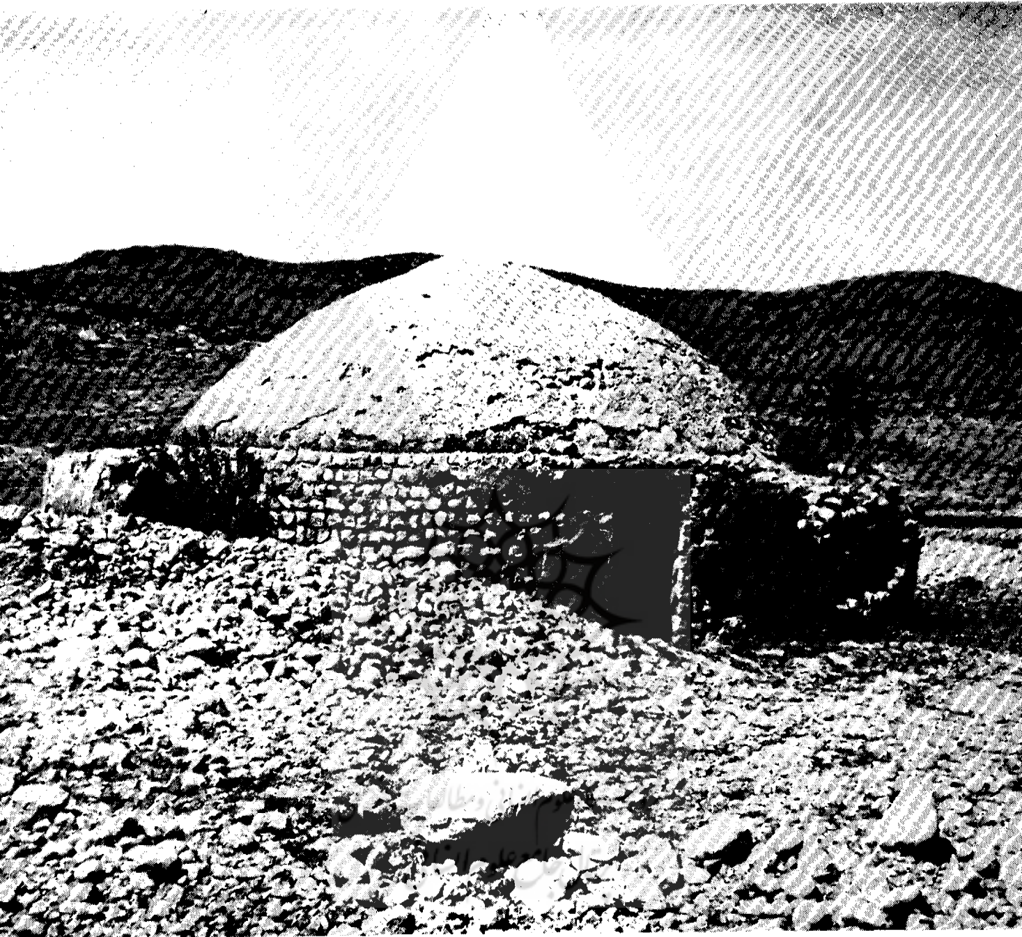
یکی از آب انبارهای قدیمی لارستان

دیده نمیشود. طاقهای ضریبی با این ارتفاع در سایر بازارهای قدیمی ایران دیده نمیشود. بلندی طاق ضریبی در چهارسوق به ۱۸ متر میرسد و عظمت حشمت‌آمیز آن تأثیر اعجاب‌انگیزی در بیننده بر جای