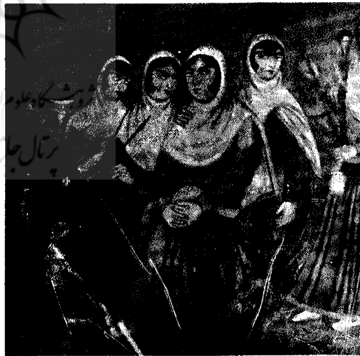
زن‌ها ۱۶۰ × ۱۴۰ سانتیمتر