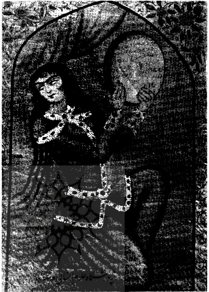
رقص با دایره ۱۰۷ × ۷۰ سانتیمتر