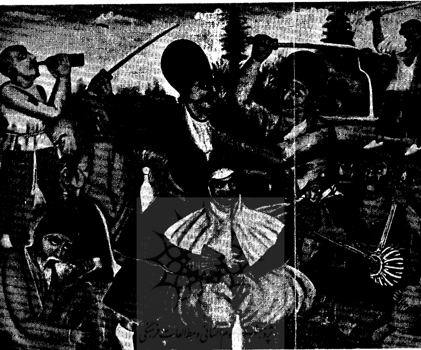
تابلو بزم لوطی ۱۰۰ × ۷۵ سانتیمتر

روی داستانهایی که میشنیدند ، تابلویی بوجود میآوردند . و اکثراً این تابلوها در همان قهوه‌خانه‌ها برای تزئین نصب میگردید .