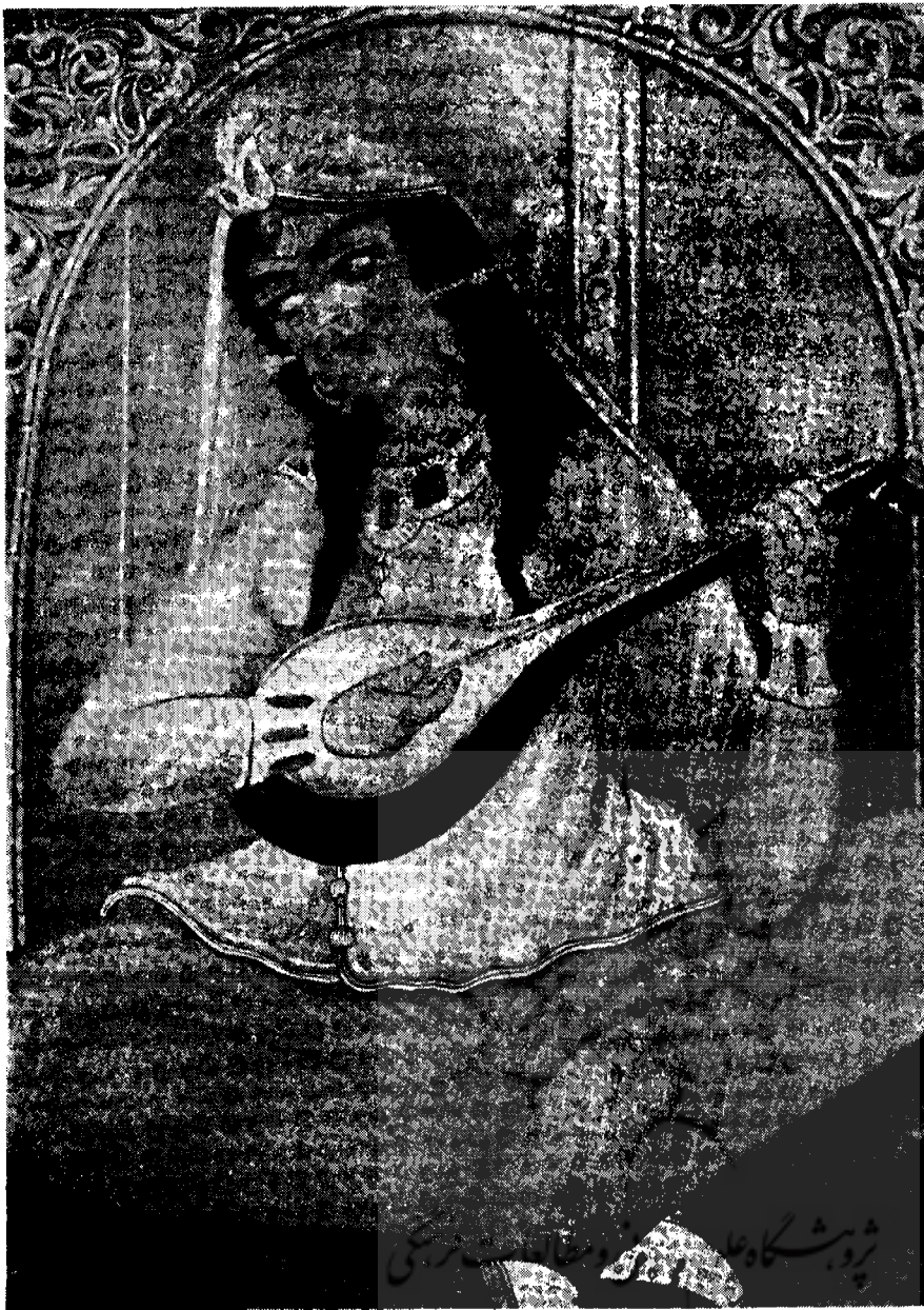
سه تار ۷۰ × ۱۰۰ سانتیمتر