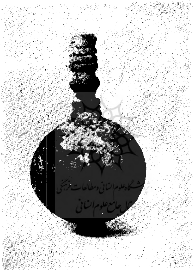
شکل (۳) شیئی فلزی شبیه به سر گرز پیدا شده از تپه حسنلو متعلق به (به سدهٔ هشتم پیش از میلاد)