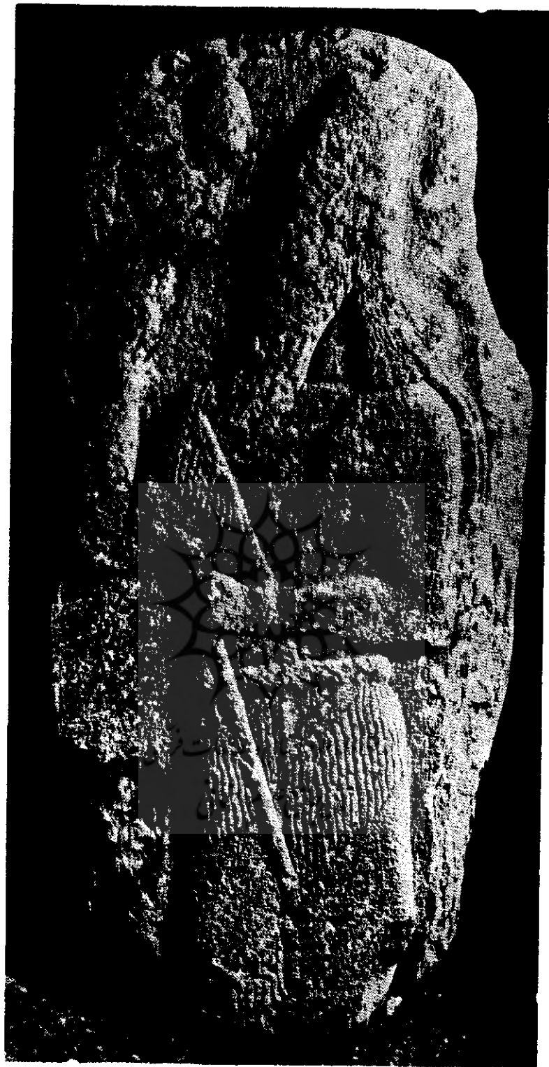
شکل (۵) نگاره سارگون دوم که در نزدیکی گودین تپه پیدا شده است