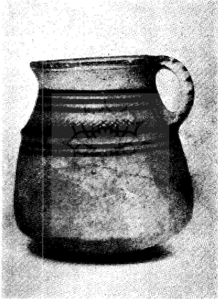
شکل (۷) کوزه سفالین دسته دار پیدا شده از تپه گیان (در حدود ۲۵۰۰ پیش از میلاد)