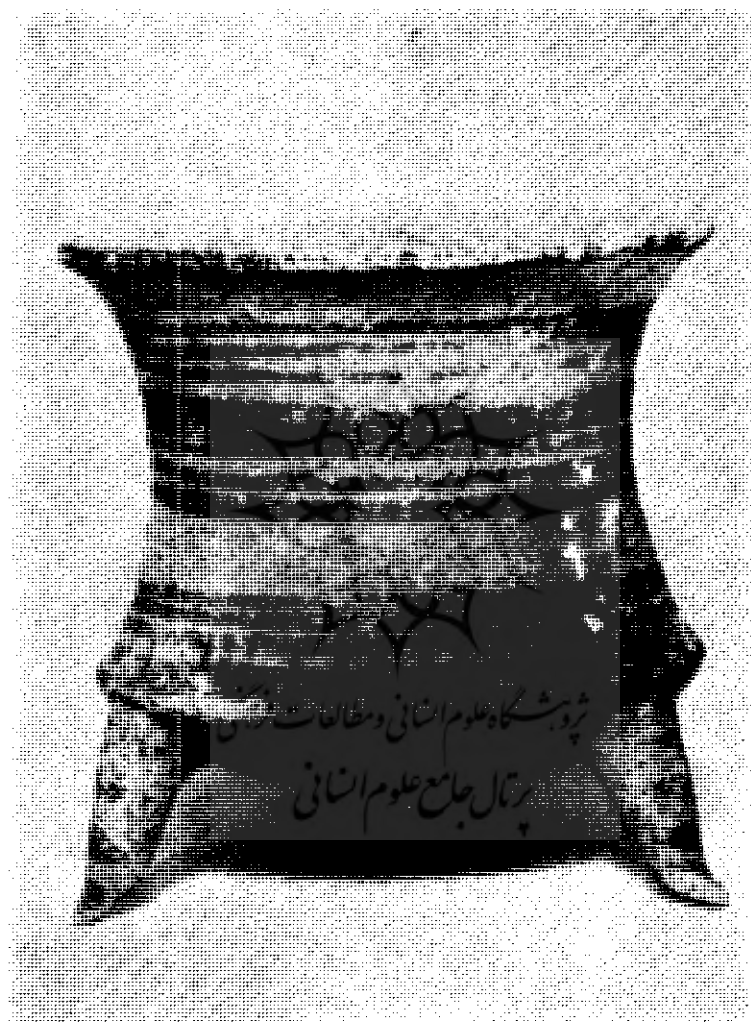
(شکل ۴) ظرف سه پایه سفالین از طبقه ۳ تپه گیان متعلق به (۲۵۰۰ - ۱۸۰۰ پیش از میلاد)