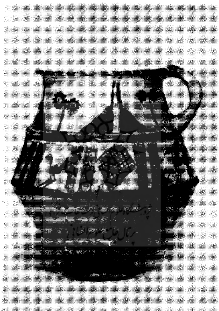
شکل (۲) - کوزه سفالین از طبقه ۲ تپه گیان (۱۸۰۰ - ۱۴۰۰ پیش از میلاد)