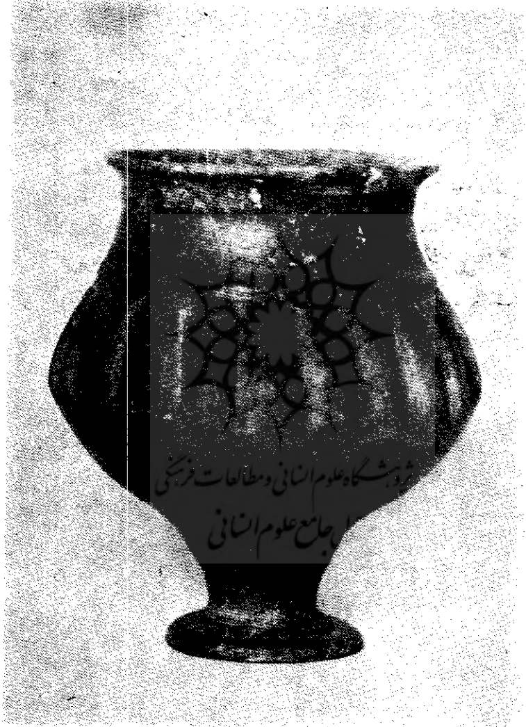
شکل (۹) ظرف سفالی پایه‌دار تپه حسنلو متعلق (به سدهٔ هشتم پیش از میلاد)