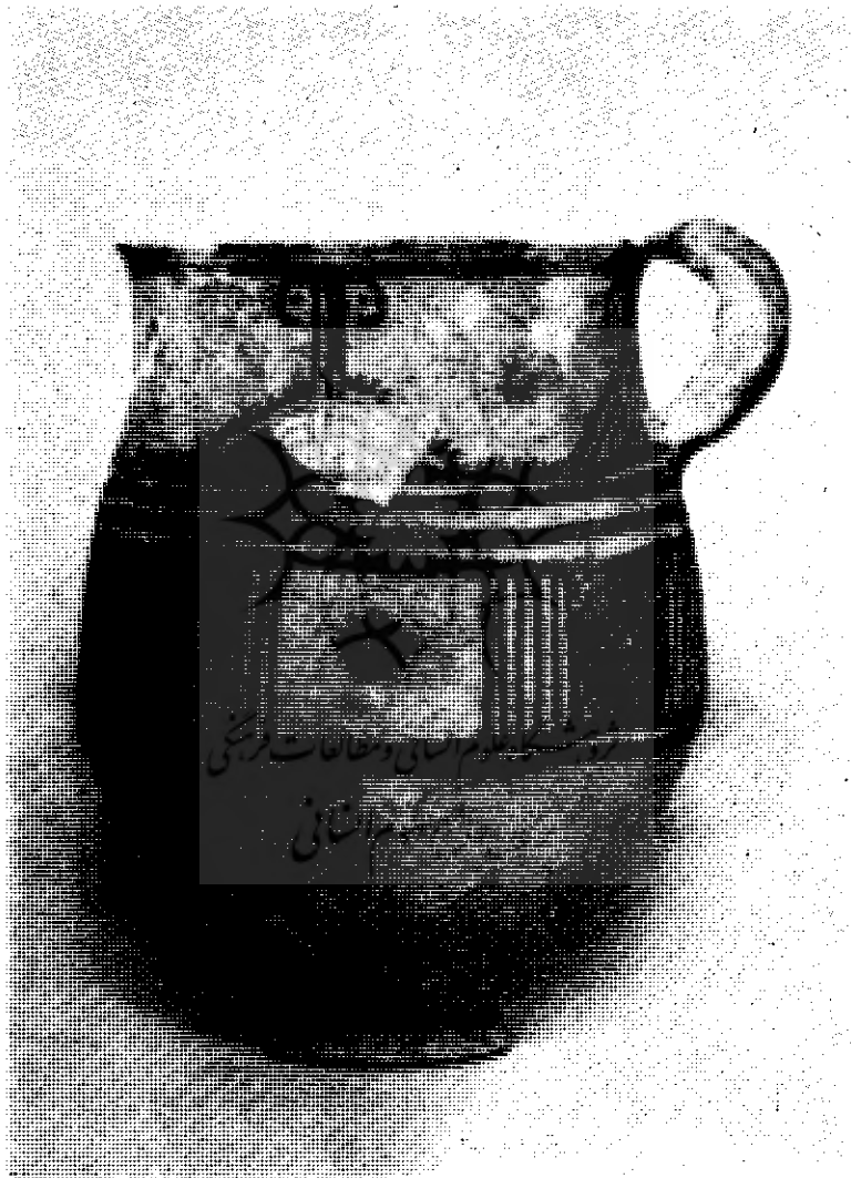
شکل (۸) کوزه سفالین از سفالهای رنگی تپه گیان متعلق به (۱۴۰۰-۱۸۰۰ پیش از میلاد)