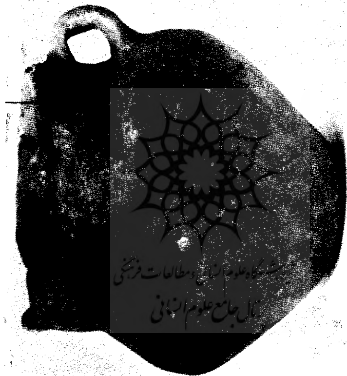
شکل (۱) - ظرف سفالی دسته دار بدست آمده از یانیک تپه آذربایجان متعلق به هزاره سوم قبل از میلاد (۲۷۰۰-۲۰۰۰ پیش از میلاد)