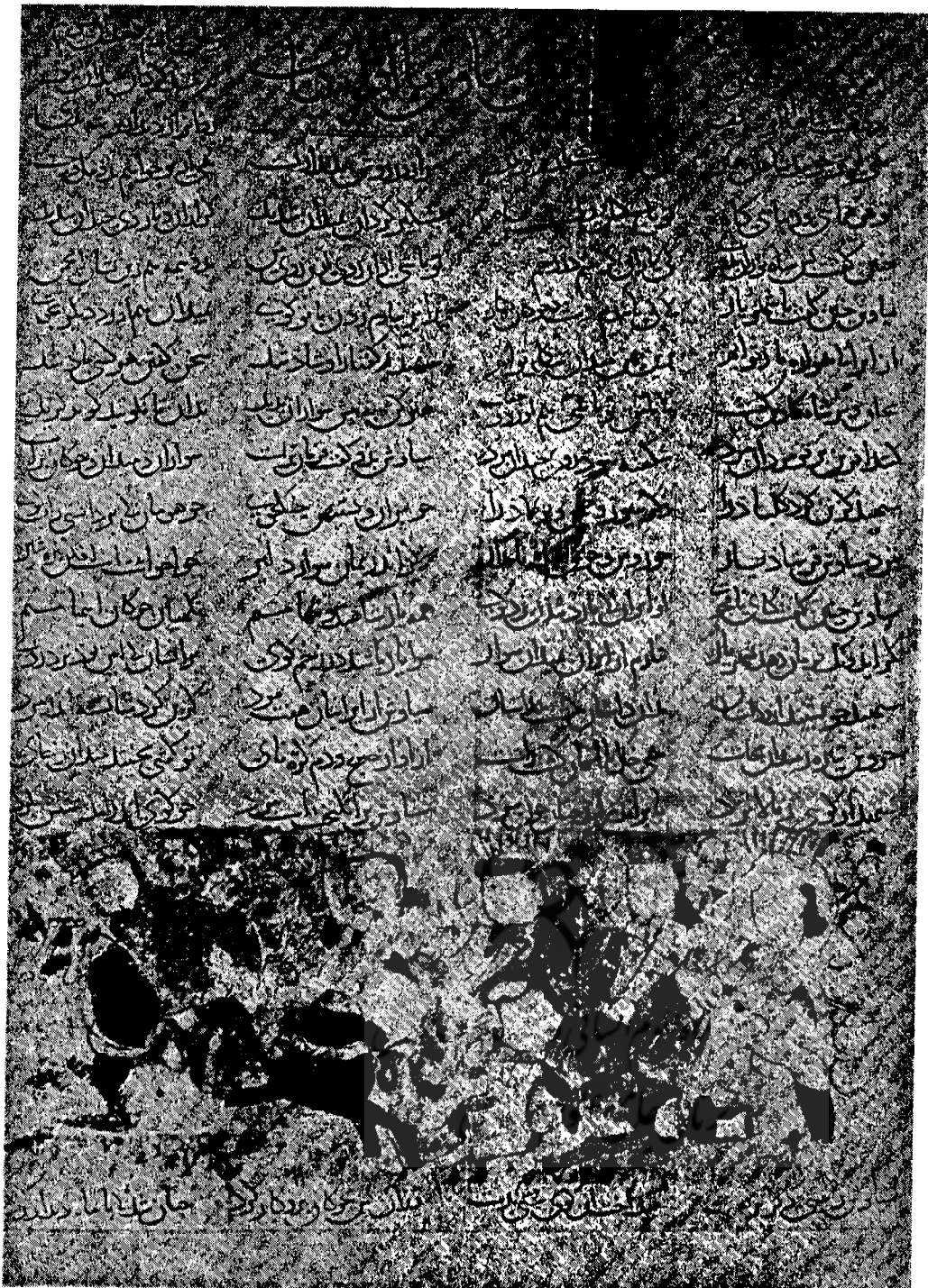
قدیم ترین شاهنامه مصور جهان