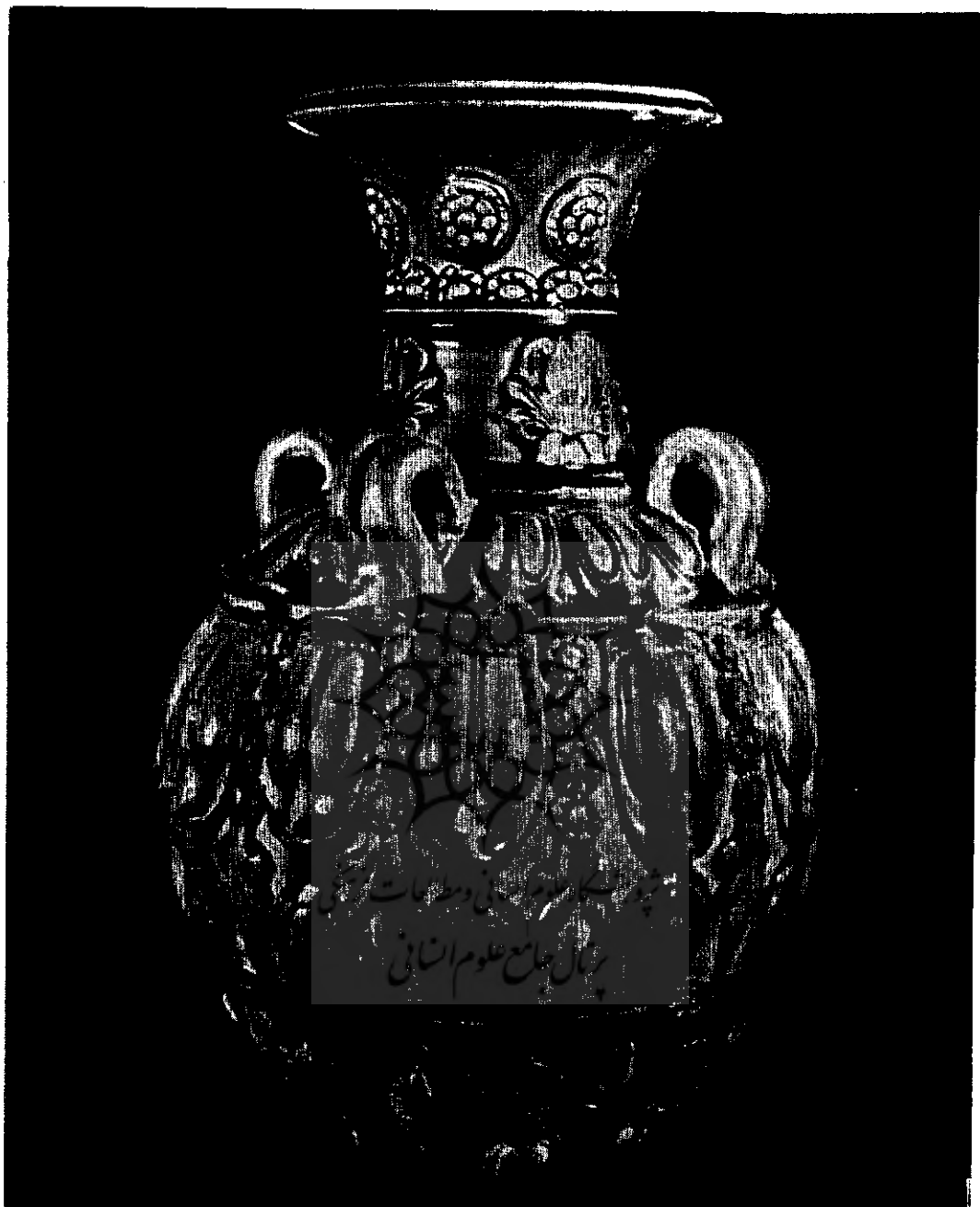
گلدان چینی متعلق به قرن ششم و هفتم بعد از میلاد و متأثر از هنر چینی سازی دوره ساسانیان .