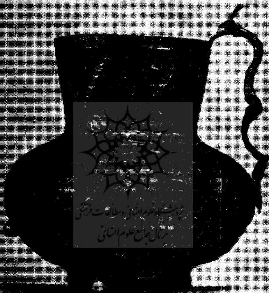
۳ - هارچ نقره‌ای تزئینی که بخشهایی از آن نیز طلاکاری شده است، از آثار هنری ایرانیان متعلق به قرن ۱۲ یا ۱۳ میلادی، ارتفاع آن ۱۲ سانتیمتر و در مجموعه خصوصی در نیویورک قرار دارد.