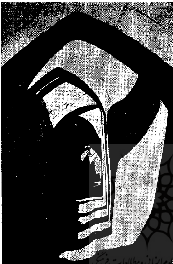
کوچه‌ای در کرمان

آشنائی اقوام به مصالح و راههای مختلف استفاده از آنها در معماری امری است که سالها بطول میانجامد و تجربه‌ها و نتایج بآن چاشنی میزند انسان پیرشدن مصالح را نظاره میکند و آنها را انتخاب مینماید که بر اثر گذشت زمان گرندی ندیده و ماده آن زیباتر و اصیل‌تر شود. باین ترتیب قسمتی از زیبایی و اصالت شهرهای ایرانی مرهون مصالحی است که در ساختمان بناهای آن بکار رفته است.