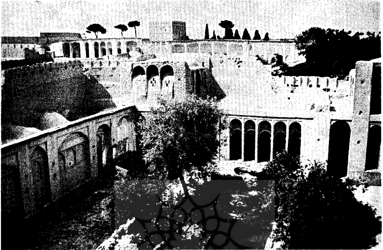
ابر قو ، نمونه شهر کاهگلی ایرانی

در مناطقی که باران‌های فصلی شدید بیارد ، ناچار هر چند سال یکبار اندود تازه‌ای از کاهگل بروی اندود سابق بام که قسمتی از قشر خود را از دست داده است کشیده شده و سپس بوسیله بام‌غلطان قشرها برای استقامت بیشتری بهم فشرده میشوند .