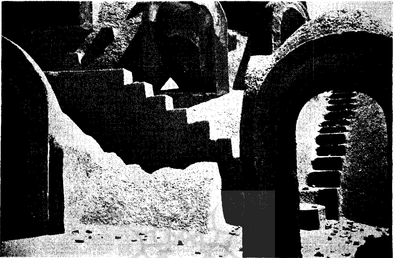
قسمتی از پوشش سالن مرکزی ساختمانی درکاشان

کاهگل را همه کس میتواند بسازد و ماوای خود را با آن بیوشاند و حفظ کند . اندود کاهگل آسان کشیده میشود . آدمی بایکدست خمیر آنرا بر میدارد و بروی سطح دلخواه پهن میکند . در این مورد حتی بکار بردن ماله در کشیدن آن روی سطوح نشانی از امکانات ساحب‌خانه است .