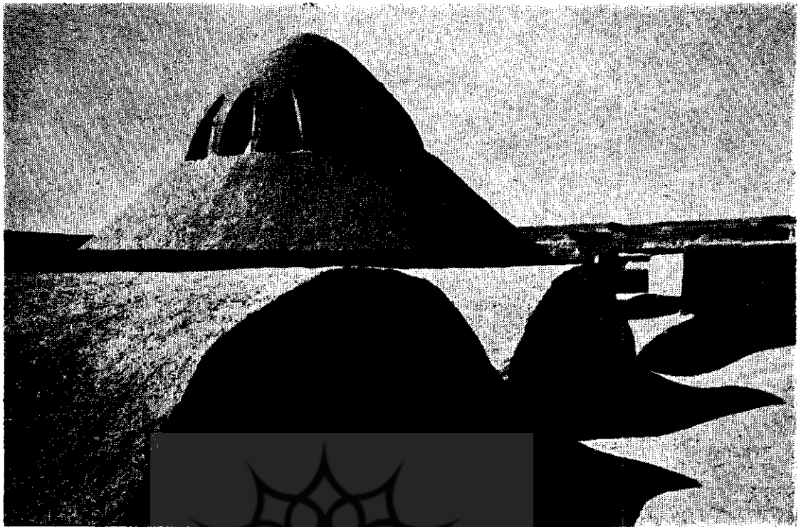
پوشش حسینه در محمدیه نائین

ملایمی می‌دهد و حیاطهای گود که اطاق‌ها آنها را دور می‌زنند یک حوض سنگی و چند درخت را در میان گرفته و بزنگی ایرانی لطافت می‌بخشد .