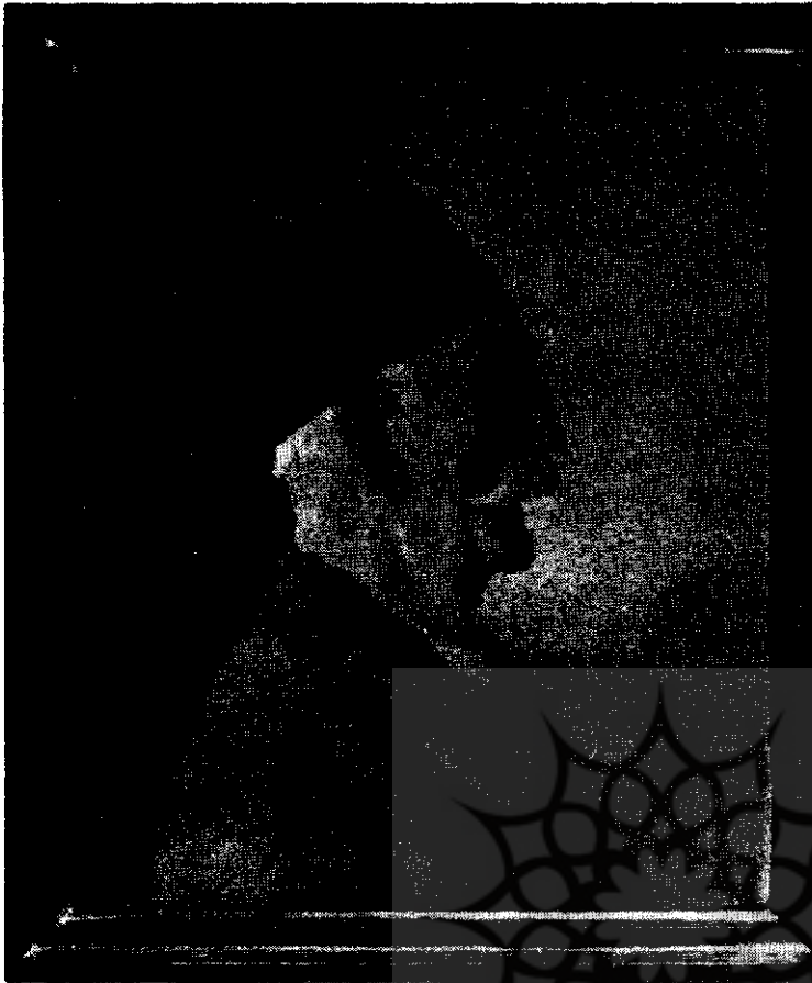
(شکل ۲) چهره کمال الملک در قالی

فرشهای تصویری بیافند، بطوریکه با بهترین کارهای استادان چینی و اروپایی دوره گوتیک برابری کند. موضوع را از روی پرده‌های مینیاتوری که برای زینت دیوارکاخها بافته شده میتوان دریافت.