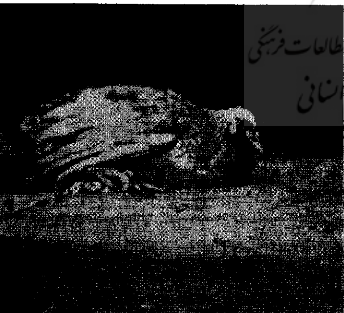
(شکل ۴) گوبلن « مرغ پا بسته »

چهره کمال الملك در قالی (شکل ۲). با اینکه هنرمند در بافت این قالی و برای بوجود آوردن این چهره، نهایت کوشش را بکار برده است، ولی باید گفت که در باب مقایسه با گوبلن (رضاشاه کبیر)، از نظر بافت و ارزش هنری در مقام دوم قرار دارد. این چهره در سال ۱۳۳۰ در مدت ۶ ماه با تمام رسیده است.