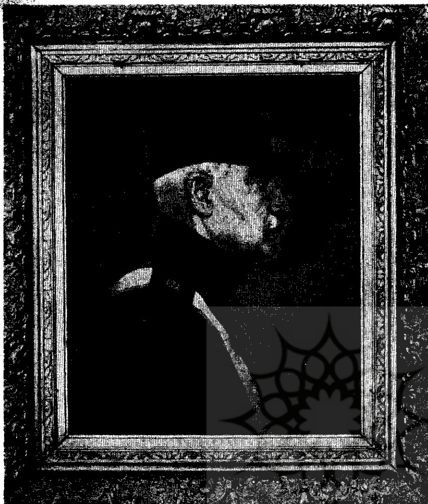
(شکل ۱) چهره رضاشاه کبیر در قالی (گوبلن)

ومیرزا علیخان محمودی که همه تحت تعلیم استاد کمال‌الملک بودند می‌گذرانید. جمشید در ابتدای کار میبایست از ابتکار و اطلاعات استادان مربوطه در همه فنون، بخصوص در طرح-ریزی و شیوه رنگ‌آمیزی تجربه اندوزد. چون، عقیده استاد کمال‌الملک بر این بود که هر هنرجو قبل از آشنایی با هنر اختصاصی خود، ابزار اولیه‌اش باید قلم و بوم تابلو باشد. امتیازی که او در سال ۱۳۰۱ بدست آورد، تعلیم دادن به هنرجویان جدیدالورود بود.