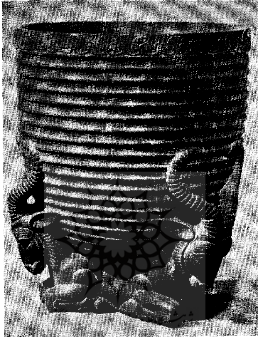
دوستکامی سنگی از دوران هخامنشی که اکنون متعلق به یکی از مجموعه‌داران اروپایی است و به نقش سه برکوهی مزین گردیده

دوران اسلامی دارد که در مساجد قرار می‌دادند و در آن برای رفع تشنگی یا برای شستن دست و رو آب می‌ریختند. بفاصله کمی از سردر ورودی تخت جمشید، حوض چهارگوش از سنگ قرار دارد، که نسبت به زمین، ارتفاعی دارد، یعنی در حقیقت حوض بزرگی از سنگ است که در روی زمین قرار گرفته (۲ متر در ۲ متر)، دور کف آن سوراخی قرار دارد که معلوم است در مواقع لازم بوسیله آن آب حوض را خالی می‌کرده‌اند. شاید هر وارد شونده‌ای که برای دیدار شاهنشاه می‌آمده قبل از ورود بتالار آیدانا یا تالارهای دیگر دست و رو می‌خورد در این