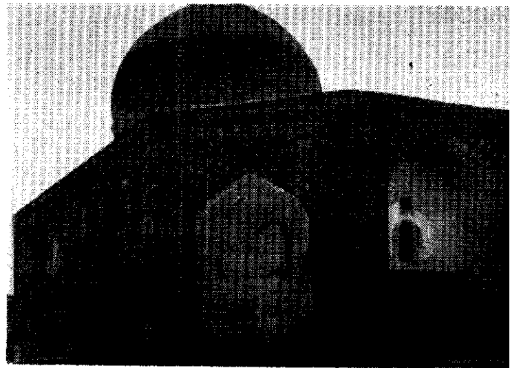
دورنمای کنونی بقعه شیخ جبرائیل در شهر اردبیل

ایوان جلو بنای بقعه شیخ جبرائیل - در وسط : در ورود به رواق دیده میشود که سابقاً نقره‌ای بود و بعداً برداشته شد . طرفین در ورودی با کاشی‌کاریهای نفیس تزیین یافته‌است