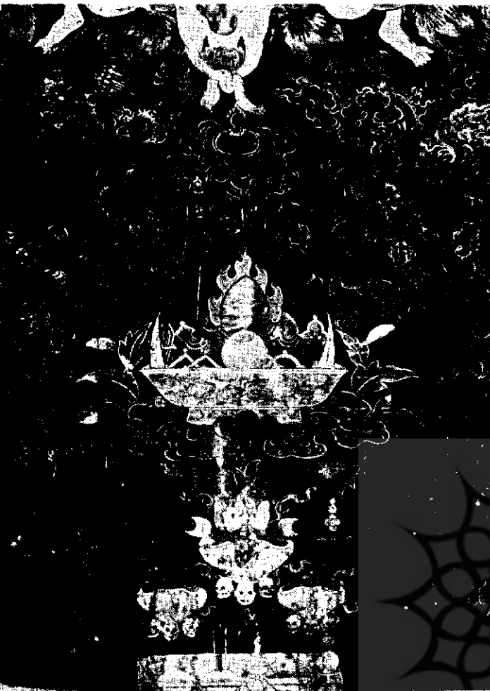
پرچم - قرن هفدهم میلادی - مجموعه‌ی توجی - هنر تبت