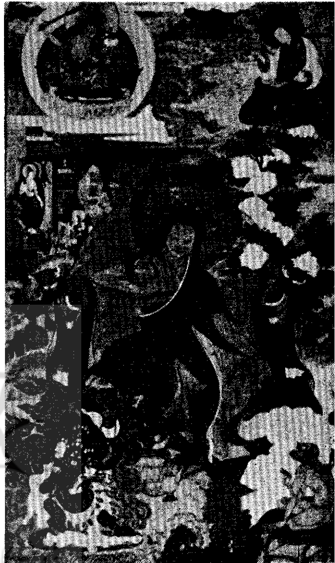
چپ : دشت بلند تبت - اثر مهاراجه سیکیم - هنر تبت