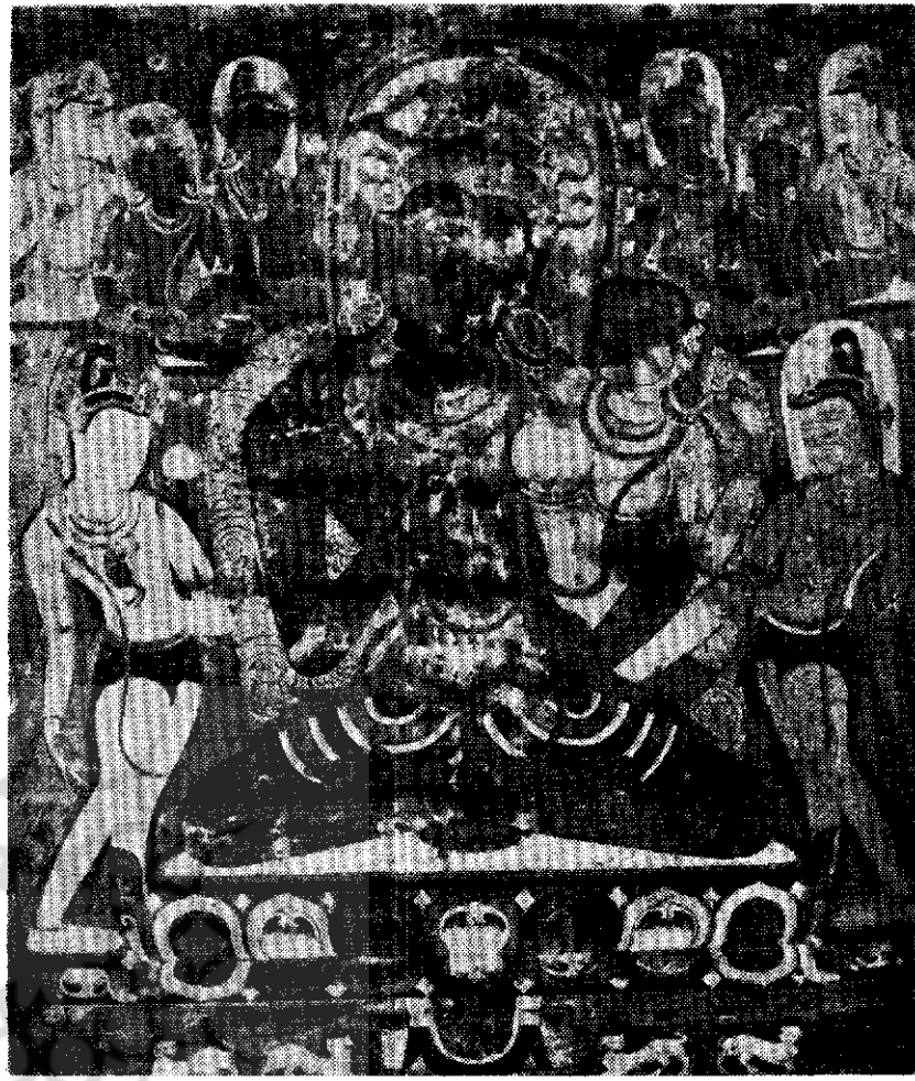
نقاشی - احتمالاً مربوط به هنر قرن شانزدهم تبت است - موزه گیمه پاریس