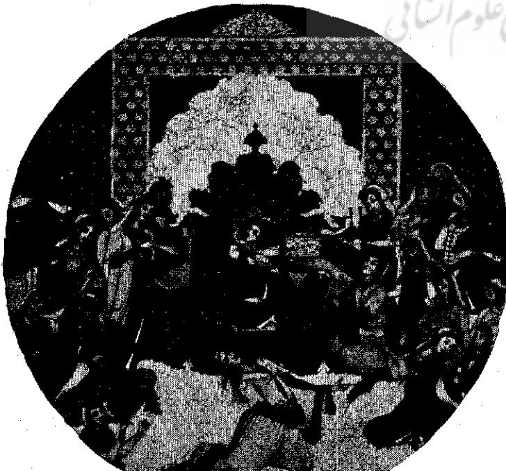
نمائی از قصر سلیمان