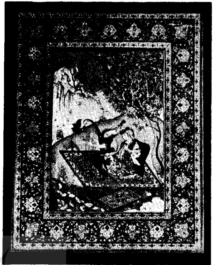
خسرو و شیرین

مجالس بزم بهرام گور ساسانی است که از آثار جاویدان ادبیات ایران یعنی هفت پیکر نظامی گنجوی الهام گرفته شده است و در نوع خود کم نظیر و ممتاز میباشد . با اینکه تابلوی فوق ناقص است یعنی از هفت مجالس فقط دو مجلس آن تزیین و تکمیل گشته است مع الوصف تجسم آن دو صحنه ، بارنگهای طلایی و قرمز خود شاهکاری است که هر بیننده ای را بتحسین و امیدارد . تذهیب اطراف موضوع توسط نصرت الله یوسفی بعمل آمده است .