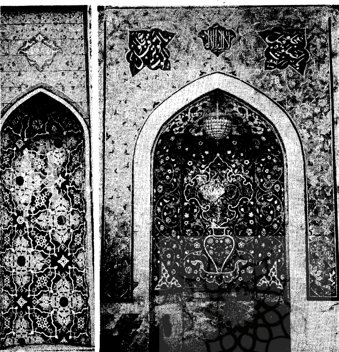
کاشی کاری محراب و کاسه معرق مسجد حاج محمدحسن درخیابان بوذرجمهری که کارگاه کاشی کاری هنرهای زیبای کشور بطور رایگان انجام داده است