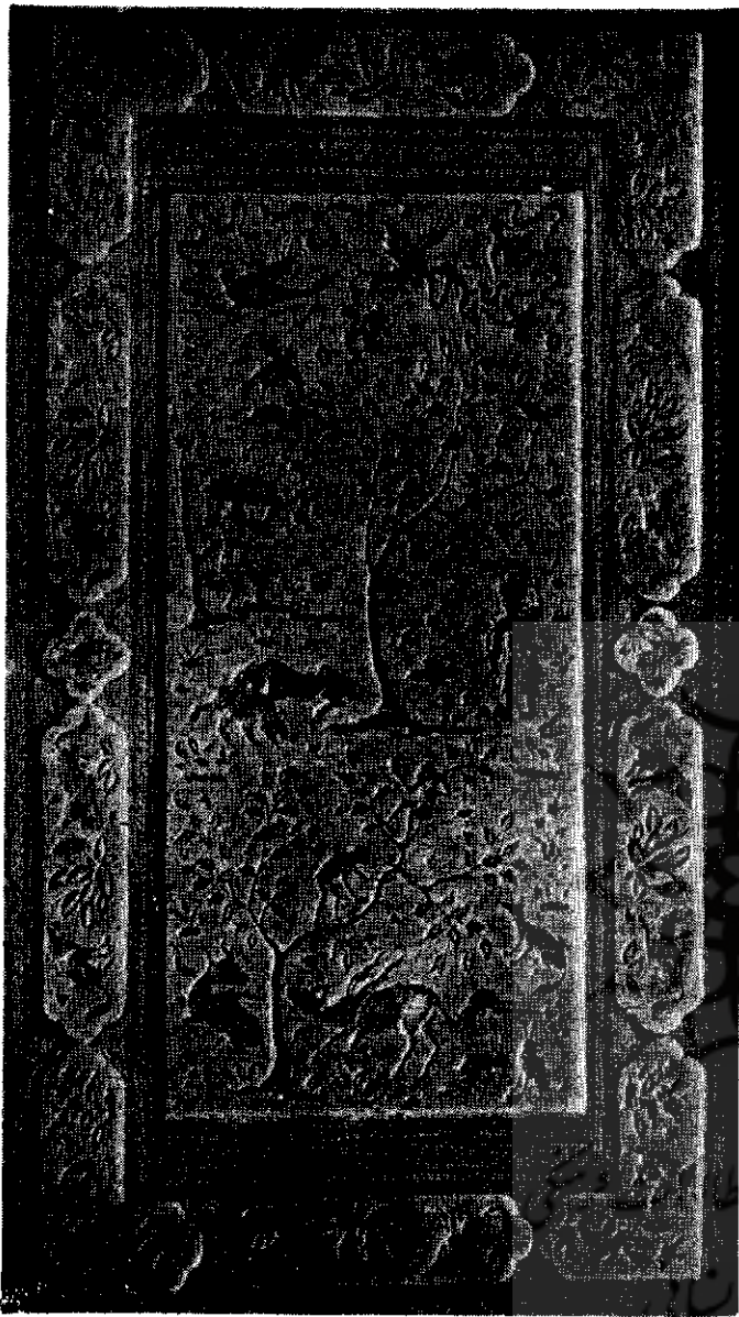
جلد چرمی زرکوب ۱۶×۲۷ سانتیمتر متعلق به دوره صفوی مجموعه گلبانگیان

مجلس بارگاه پادشاه یا مجلس بزم اضافه میگردد . در عهد صفوی فن جلد سازی مانند سایر فنون به اعلا درجه ترقی خود رسید . ابتدا مرکز آن شهر تبریز بود و سپس شیراز و اصفهان نیز در ردیف اول شهرهایی که هنر جلد سازی در آن معمول گردید قرار گرفته . در عهد شاه عباس خریداران این هنر زیاد شدند و در نتیجه هنرمندان توانستند آن دقتی را که