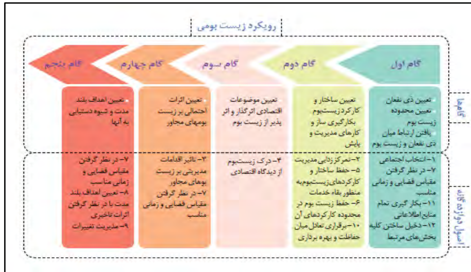
شکل ۱. اصول دوازده گانه