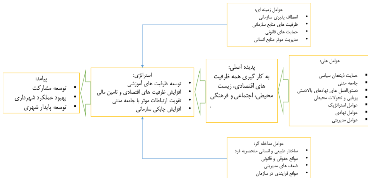
شکل ۲. الگوی پیشنهادی ارتقاء تاب‌آوری کالبدی در برابر خطر زلزله

این الگو با ترکیب یافته‌های پژوهش در قالب نظریه داده بنیاد و با در نظر گرفتن شرایط خاص منطقه ۱۹ تهران طراحی شده است. الگوی پیشنهادی در پنج لایه به هم پیوسته توسعه یافته که هر لایه بر اساس کدهای استخراج شده از مصاحبه‌ها و تحلیل‌های میدانی شکل گرفته است. این الگو با ترکیب رویکردهای کالبدی و برنامه‌ریزی شهری، چارچوبی عملیاتی برای ارتقای تاب‌آوری منطقه ۱۹ تهران ارائه می‌دهد. موفقیت الگو منوط به تعامل هم‌زمان تمام لایه‌ها و مشارکت فعال ذینفعان است.