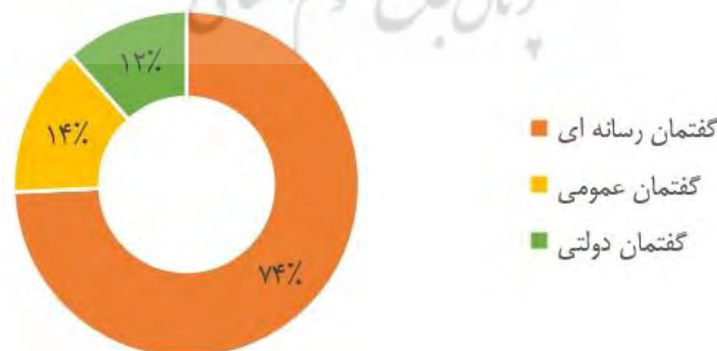
شکل ۱. توزیع اسناد تحلیل‌شده بر اساس گفتمان‌های رسانه‌ای، عمومی و دولتی

در این بخش از پژوهش، به بررسی و آماده‌سازی داده‌های جمع‌آوری شده برای تحلیل پرداخته می‌شود. این مرحله از اهمیت ویژه‌ای برخوردار است، زیرا کیفیت و دقت نتایج تحلیل به‌درستی پالایش داده‌ها وابسته است. با انجام این مراحل، داده‌های آماده‌سازی شده برای تحلیل در بخش بعدی آماده می‌شوند. این فرایند امکان دستیابی به نتایج دقیق‌تر و پاسخ به سؤالات پژوهش را فراهم می‌آورد. برای پالایش داده‌ها در این بخش از عامل‌های بازه زمانی، دسترسی کامل به متن الکترونیکی، نگارش به زبان فارسی بهره‌برداری شده است که