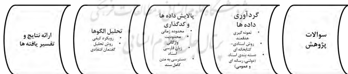
شکل ۲. فرایند روش‌شناسی پژوهش

در نهایت، یافته‌ها در چارچوب نظری تحلیل گفتمان انتقادی و با ارجاع به تعامل گفتمان‌ها با ساختارهای اقتصادی و اجتماعی تفسیر شده‌اند. به کارگیری تلفیقی از نظریه‌های زبان‌شناسی انتقادی، ایدئولوژی، و روش‌شناسی کیفی، پژوهش حاضر را به یکی از معدود مطالعات میان‌رشته‌ای در زمینه «حق به شهر» در ایران بدل کرده است.